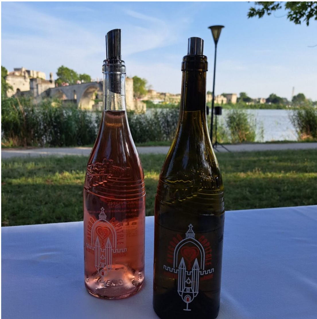
La nouvelle bouteille des Côtes du Rhône

Le tout arrosé de Côtes du Rhône et Côtes du Rhône Village, servis dans la nouvelle bouteille qui met en valeur les trois couleurs, blanc, rosé et rouge. Un moment de partage et de convivialité sous les étoiles. Une parenthèse de bonheur, un instant suspendu dans les temps troublés que nous traversons.