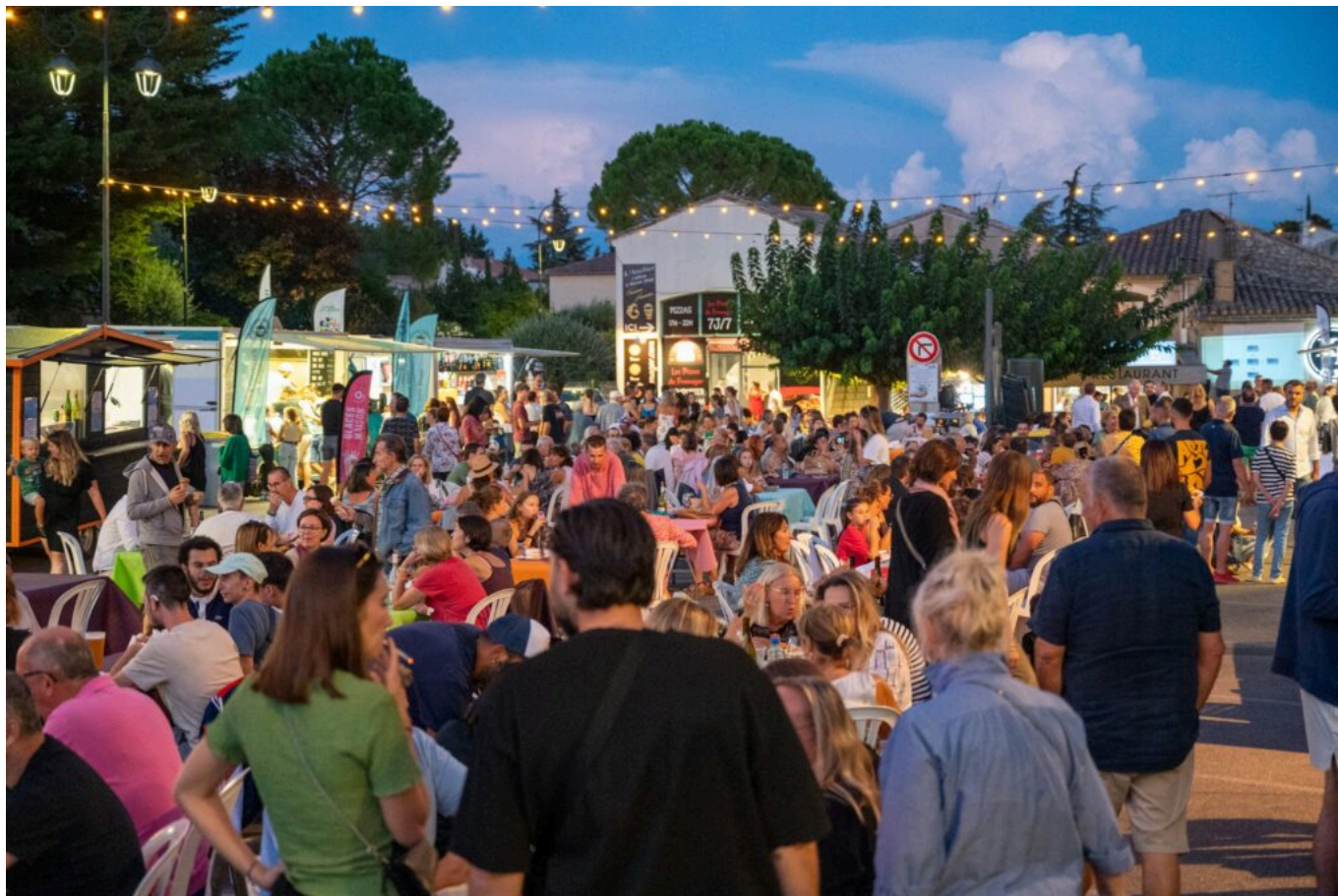
La soirée des Défis Foodtruck.