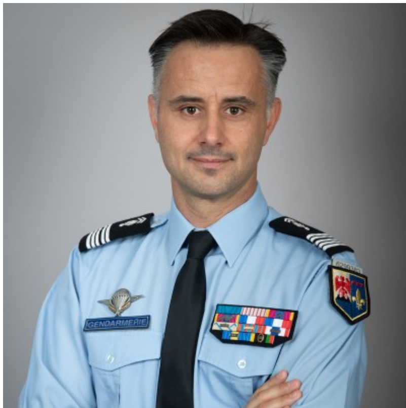
Le colonel Cédric Garence, nouveau patron des gendarmes de Vaucluse.