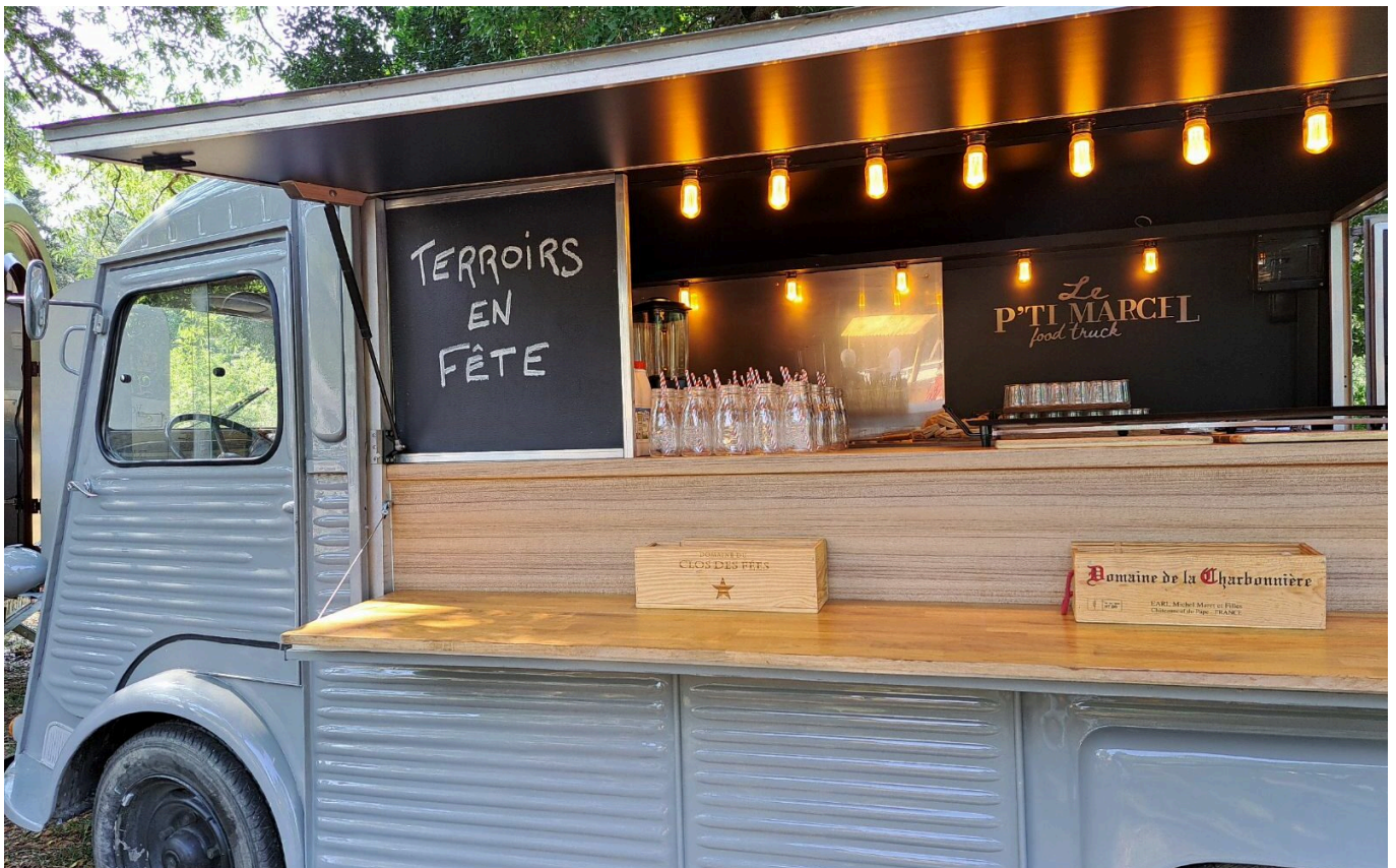
Le P'tit Marcel du P'tit camion

ma revanche sur ma scolarité. Ceux qui pensent qu'ils sont arrivés, en fait ne sont pas partis. Dans ma brigade aux Baux-de-Provence, nous sommes 67. Chacun a sa partition à jouer pour mettre en musique les recettes. Parfois, il faut des mois de travail pour concocter, concevoir et dresser une assiette, c'est un travail d'équipe et de longue haleine. Seul on va plus vite, mais ensemble on va plus loin ».