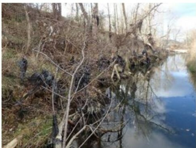
Avant journée de nettoyage du 19 avril 2023

Ainsi, le 15 mars, une première opération sur le secteur du Pont Julien avait eu lieu, réunissant une cinquantaine de jeunes des centres de loisirs, qui avaient pu ramasser près de 3 m 3 de déchets. Une deuxième journée ouverte à tous avait également eu lieu le 19 avril sur le secteur de Goult (voir photo ci-dessous), pour poursuivre le nettoyage de la rivière et la sensibilisation à la gestion des déchets. Près de 2 tonnes de déchets avaient été collectées.