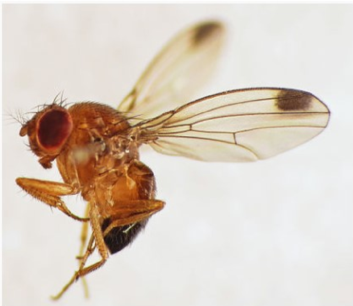
La Drosophila suzukii , ravageur de fruits et oléagineux