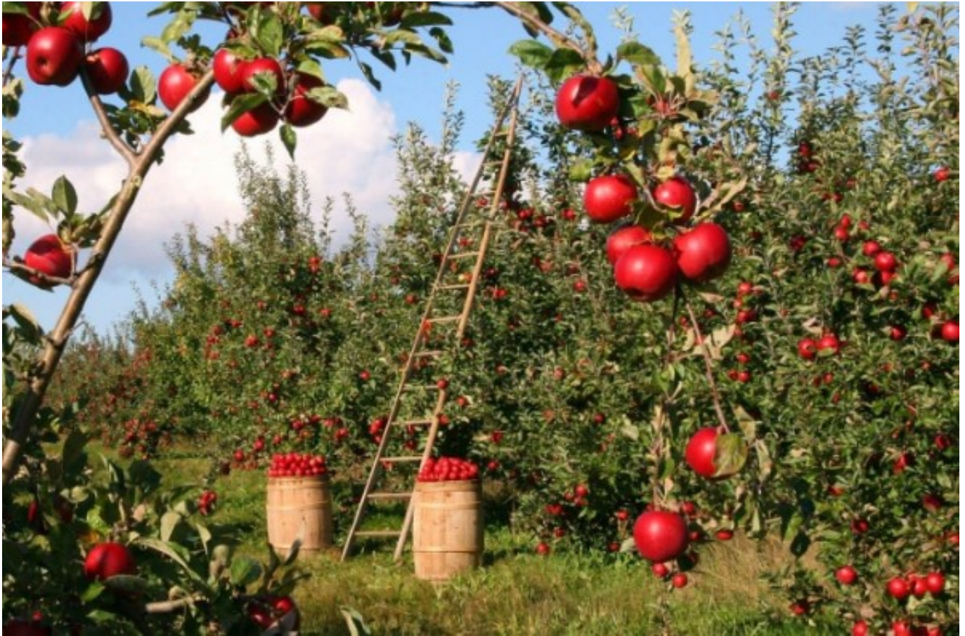
Verger de pommes