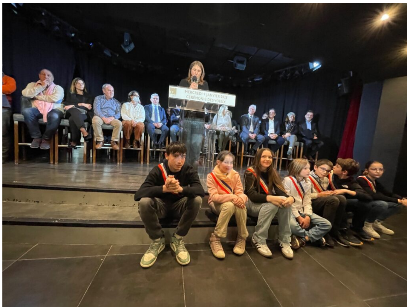
Le conseil municipal des enfants, Copyright MMH