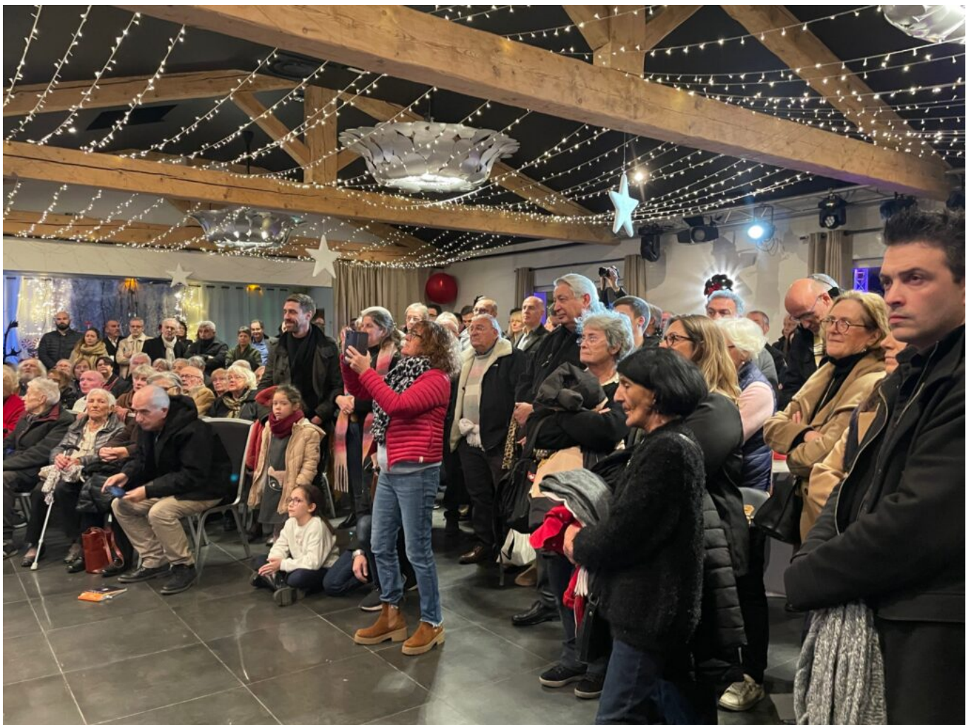
Plus de 400 personnes s'étaient rendues aux vœux, Copyright MMH

À l'instar des préoccupations nationales, la sécurité demeure une priorité locale. Avec 85 caméras pour 13 000 habitants, Villeneuve-lès-Avignon figure parmi les communes les mieux équipées de France en matière de vidéoprotection. Ce dispositif, complété par une application municipale de signalement des incivilités, vise à renforcer la réactivité des services et la proximité avec les habitants.