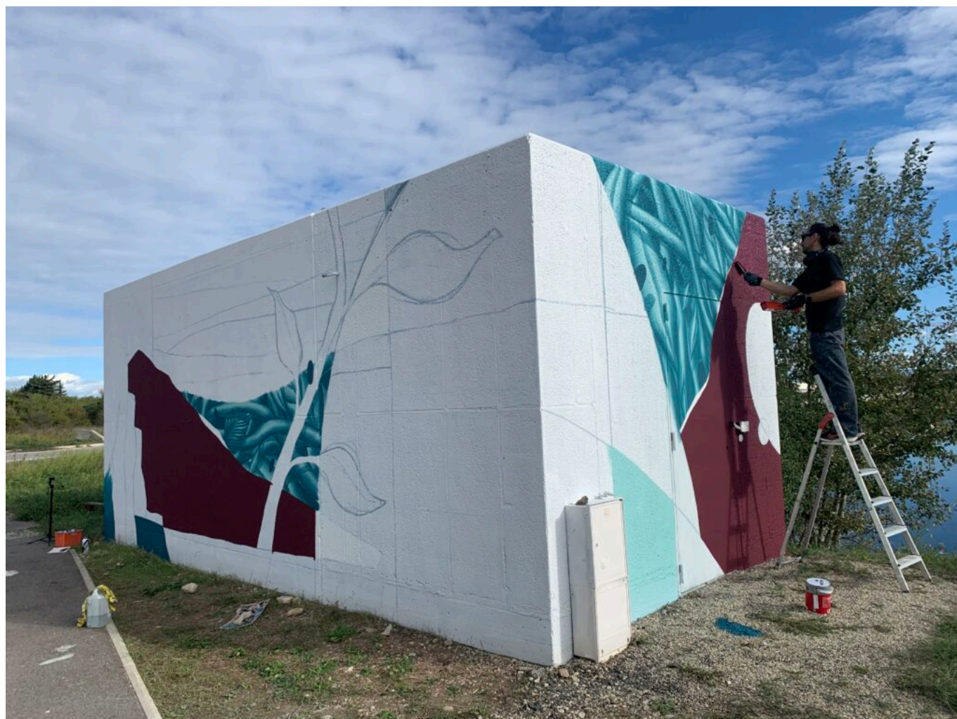
Travail préparatoire de l'artiste Jordan Harang