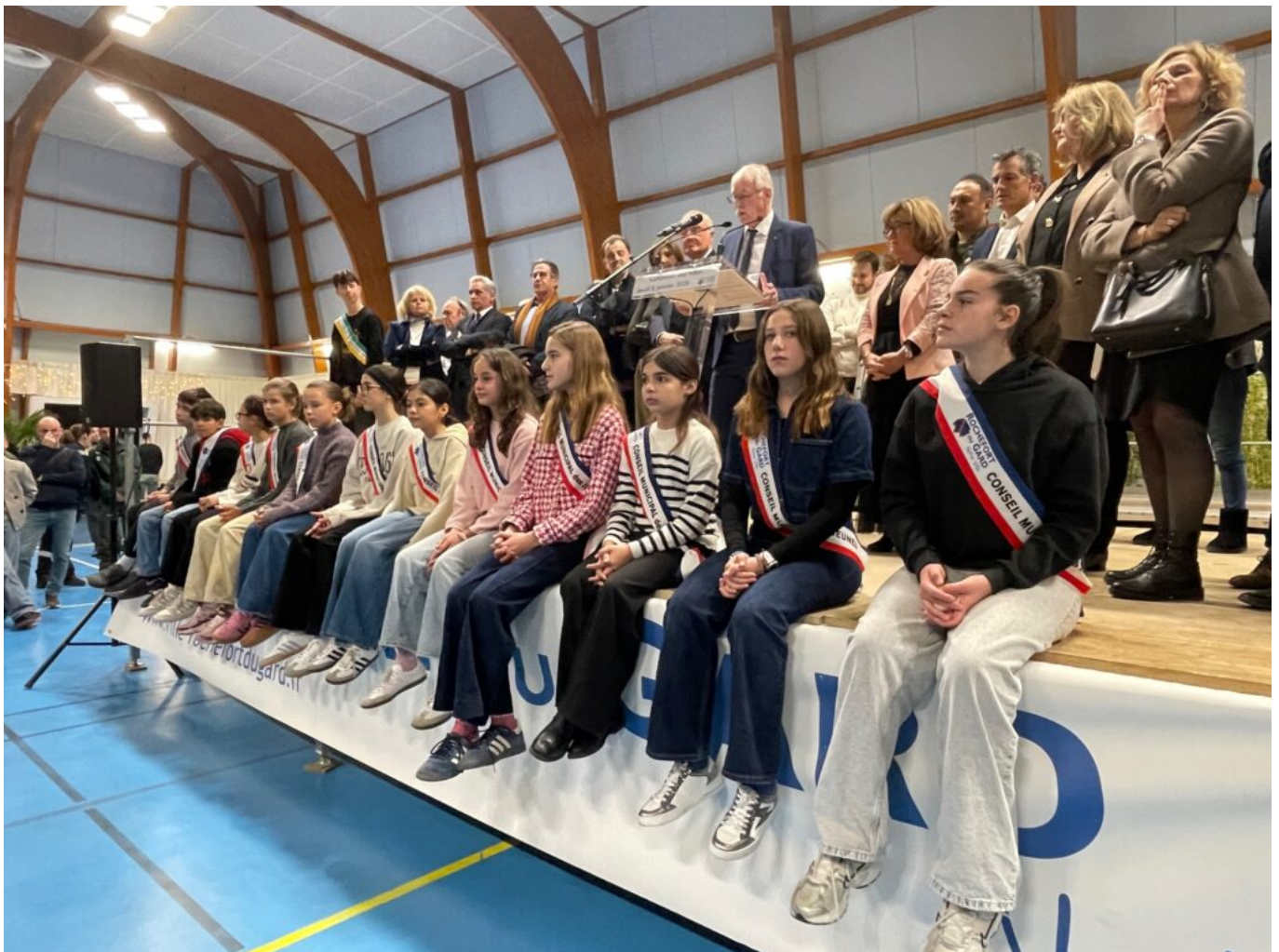
Le Conseil municipal des jeunes

Au-delà des chiffres et des équipements, le maire a insisté sur ce qui fait l'identité de Rochefort-du-Gard : un esprit de proximité et de convivialité. L'année 2025 a été rythmée par de nombreux temps forts tels que les journées des associations, et des bénévoles, la cérémonie des sportifs méritants, les marchés de producteurs, les soirées food-trucks, Halloween ou encore la fête votive, saluée pour son succès populaire et l'implication du comité des fêtes. « Ces rendez-vous, devenus de véritables rituels, participent à la qualité du vivre-ensemble et à l'ancrage d'un sentiment d'appartenance, dans un quotidien parfois marqué par les tensions et l'accélération des rythmes de vie, a relevé Rémy Bachevalier.