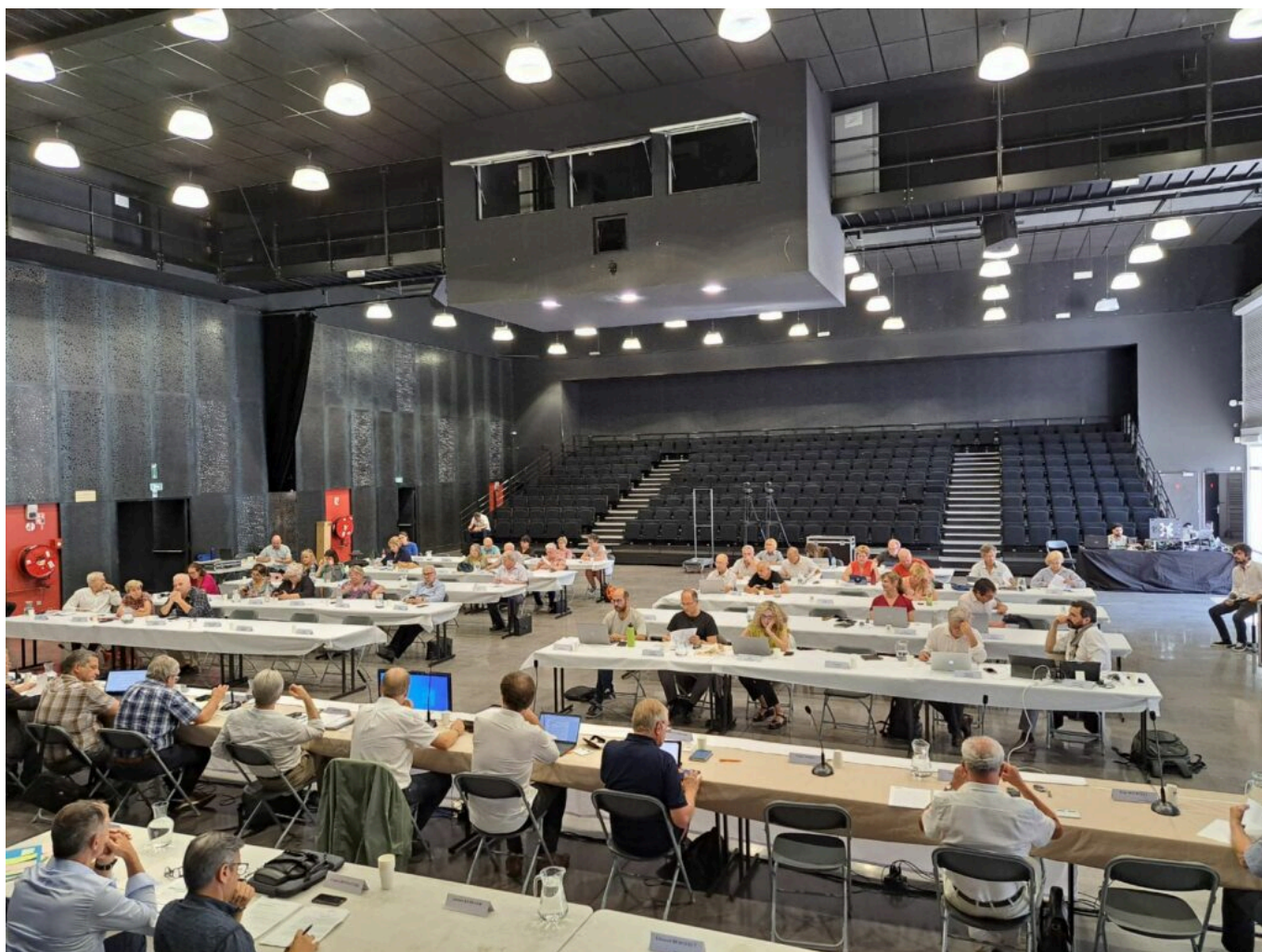
Les élus communautaires lors de la séance plénière du lundi 26 juin 2023.

Au-delà des chiffres, ces investissements permettent d'équiper les 16 communes du Grand Avignon et de réussir la transition écologique. Exemples de projets majeurs structurants (à hauteur 13M€), avec la construction des parkings-relais de St-Chamand et Agroparc (5M€), la baisse des tarifs du réseau de transports en commun Orizo (700 000€), l'achat de nouveaux bus et de Baladines électriques (5M€), le réaménagement de la Gare multimodale d'Avignon, la création de pistes cyclables aux Angles, au Pontet, à Morières, Avignon, Pujaut et Villeneuve. A propos de transports en commun, une fois de plus, Jean-Pierre Cervantes a enfourché son cheval de bataille, son credo de la gratuité. Notamment pour les scolaires. « Ce n'est pas parce que nous avons de la trésorerie que nous pouvons jouer aux vases communicants et passer d'une ligne budgétaire à l'autre, ce n'est pas si simple » a répondu le vice-président en charge des finances.