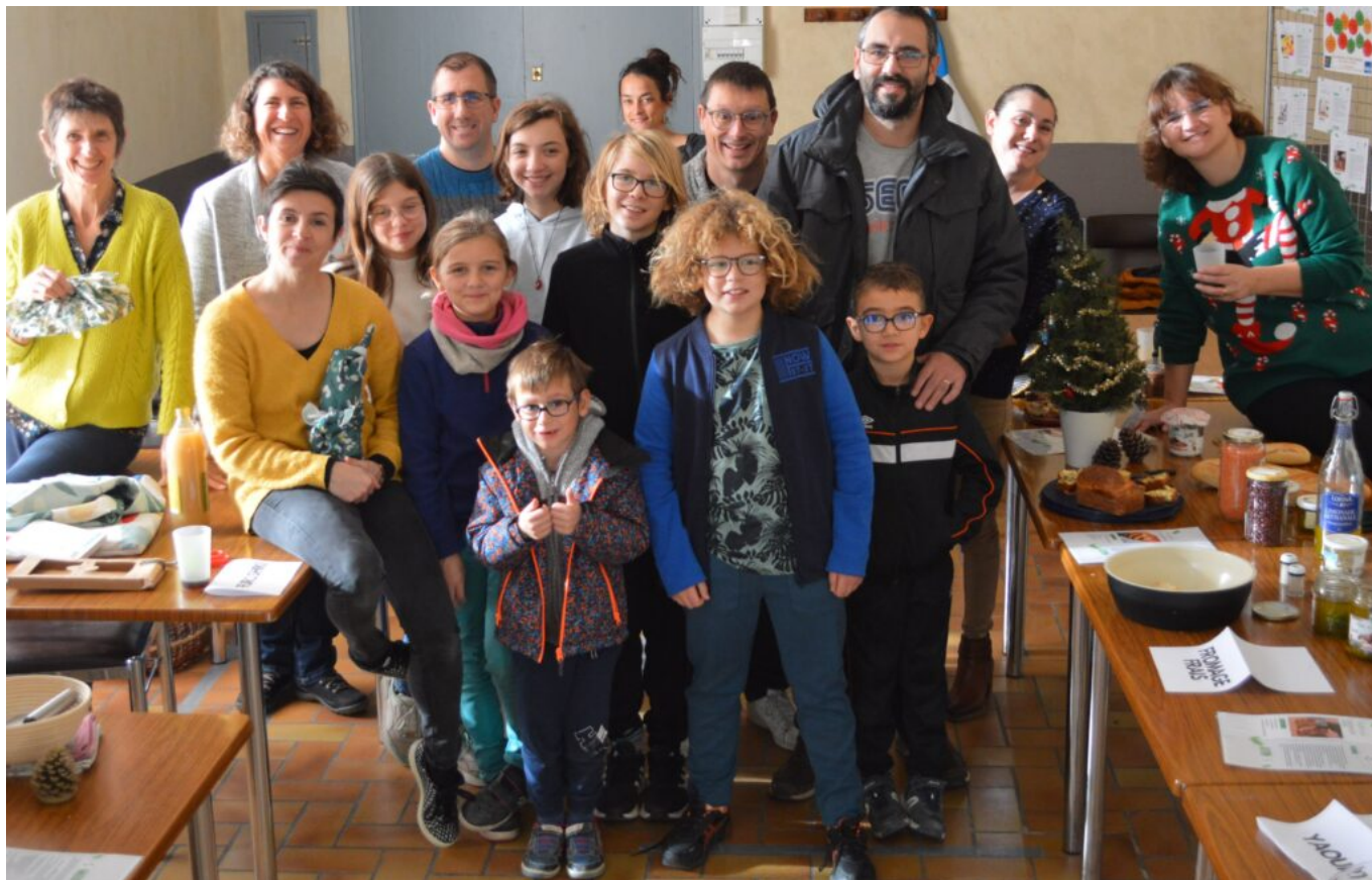
Les familles zéro déchets