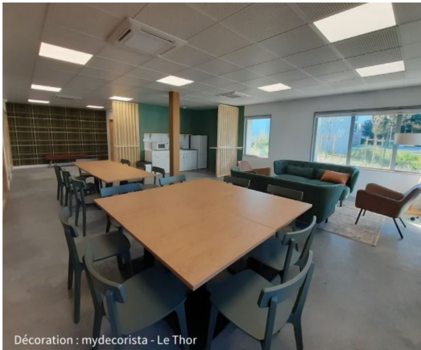
Espaces partagés du Victoria

techniques divisibles en modules de 98m 2 de surface de plancher (en moyenne). Les fonctions techniques pourront être positionnées en RDC (rez-de-chaussée) et une mezzanine pour les espaces de bureau. Le format type d'une plateforme technique sera 50m 2 au sol et 48m 2 en mezzanine. La hauteur en RDC sera plus élevée que les espaces de bureaux en mezzanine. Une plateforme technique pourra néanmoins être totalement dédiée à des bureaux.