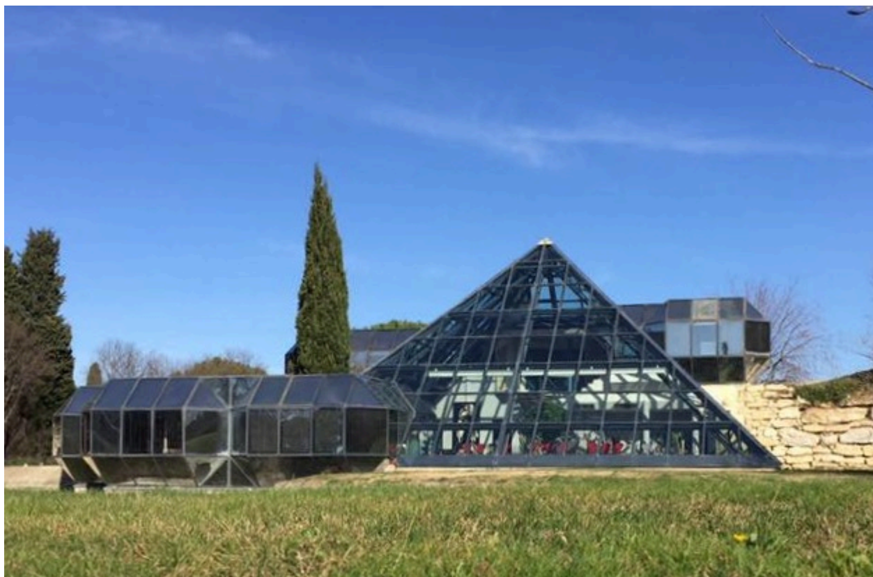
Ce à quoi ressemblait la pyramide avant sa destruction