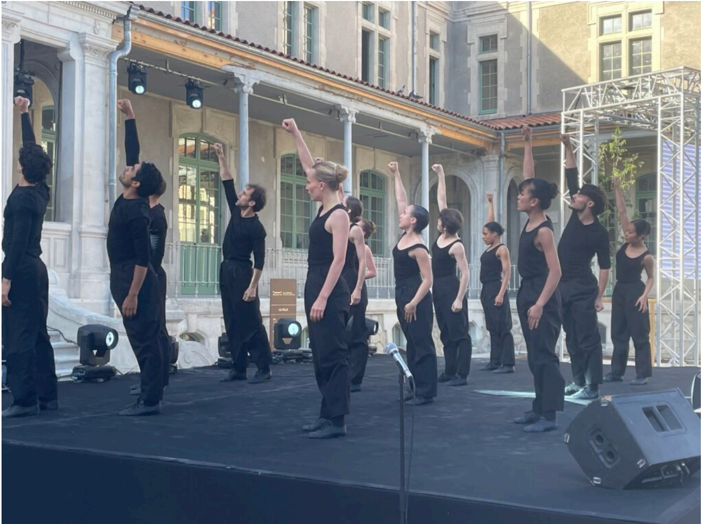
Les danseurs de l'Opéra d'Avignon