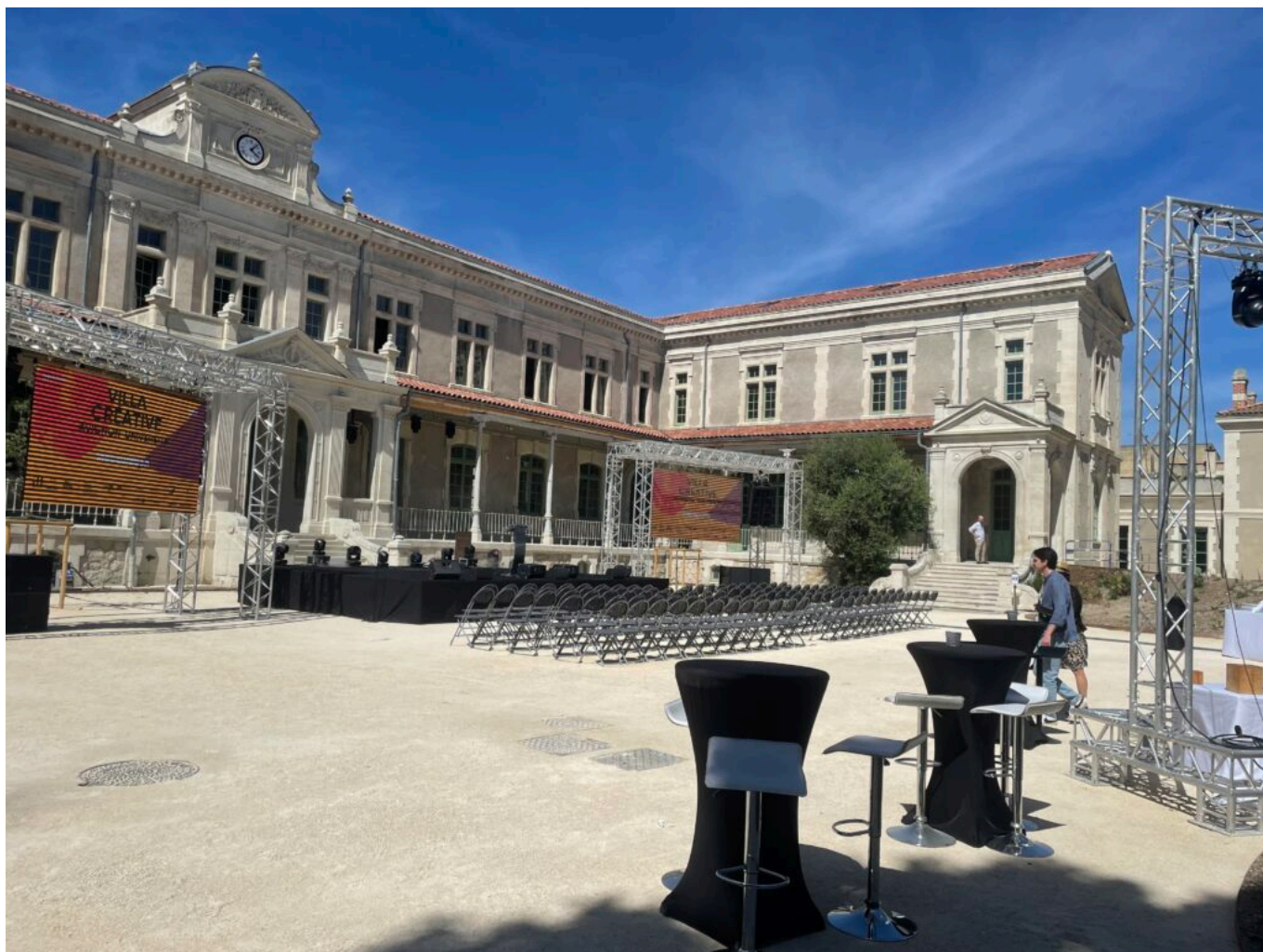
La Villa créatrice, en lieu et place de l'ancienne faculté des sciences

jardins et de bâtiments patrimoniaux, quatre pavillons, quatre galeries, un auditorium, un studio de captation audio-vidéo, des bureaux, un jardin et même une brasserie. Elle accueillera des expositions d'art contemporain, des résidences d'artistes, des rencontres littéraires, des conférences et séminaires scientifiques, des ateliers de recherche, des forums scientifiques, des programmes pédagogiques, des cours et formations, de sessions de mentorat et des projets collaboratifs.