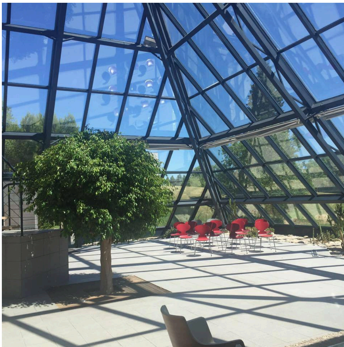
La pyramide de l'intérieur.