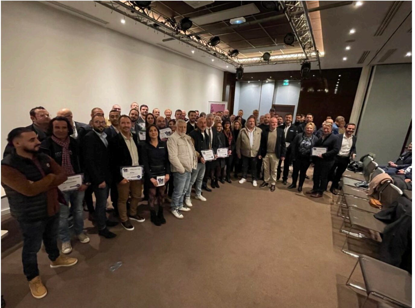
Les 47 représentants des entreprises labellisées par Grand Delta Habitat