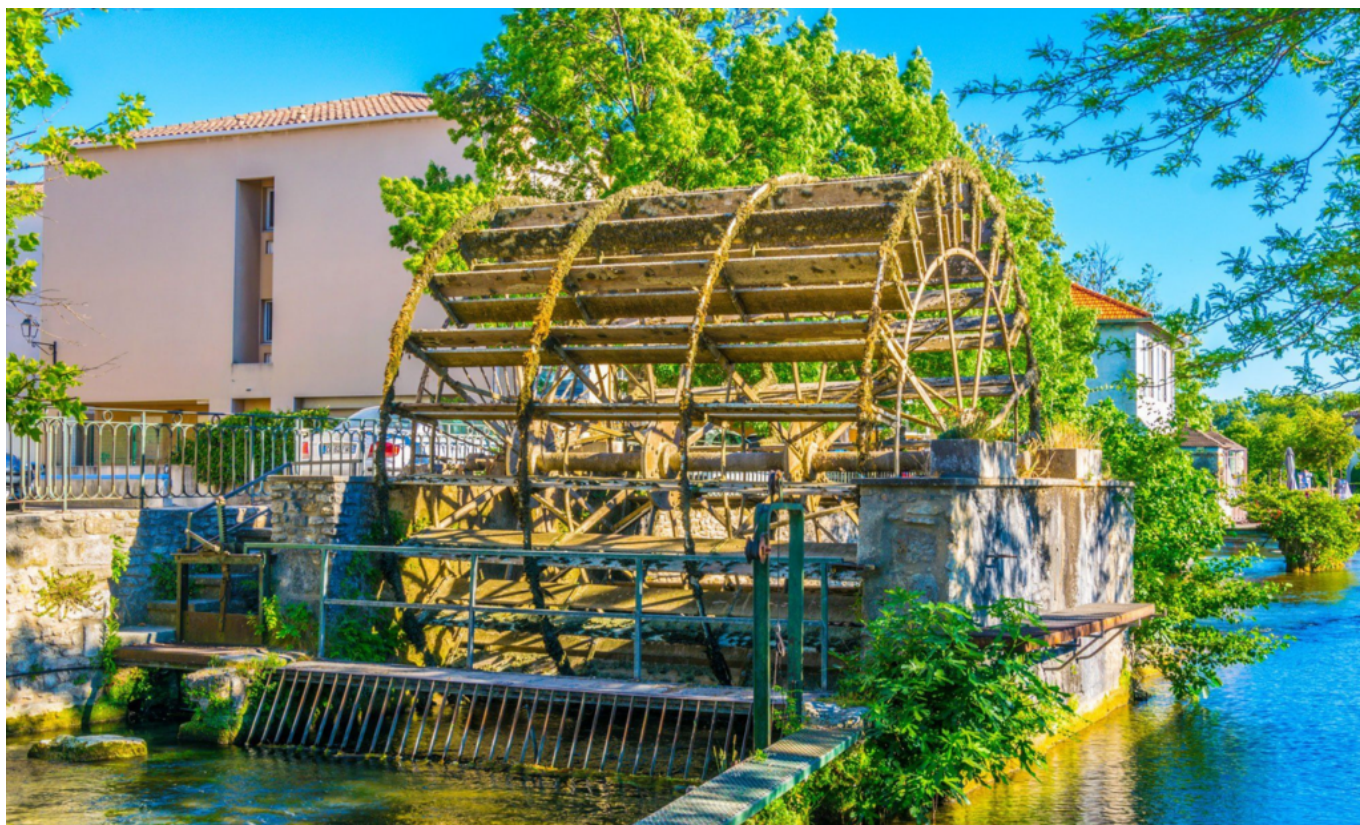
Les roues à aubes de l'Isle-sur-la-Sorgue