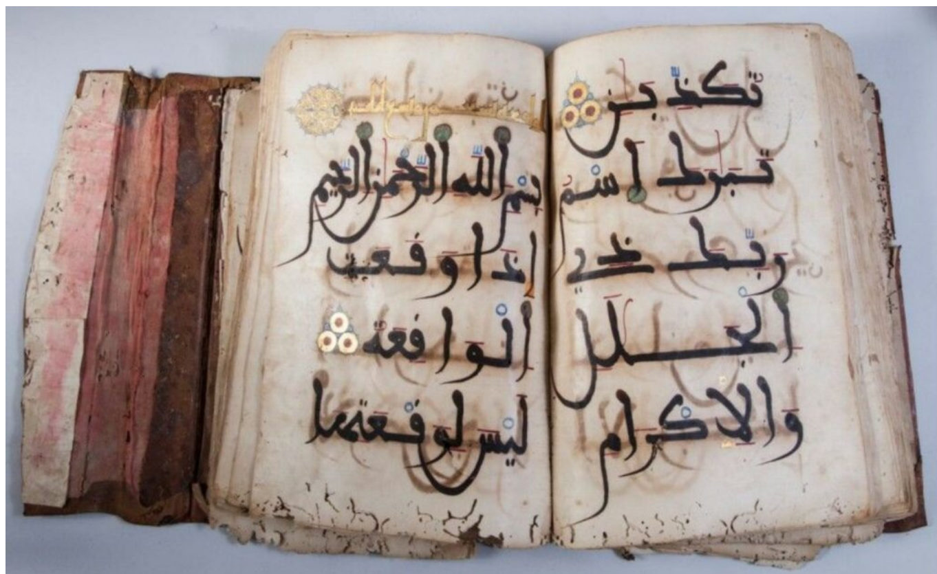
Manuscrit ancien

Jeudi 2 mars, Hôtel Toppin 70, Cours Gambetta à Cavailon. Jeudi 9 mars, à la Passerelle, Espace de Coworking, 59, avenue de la Synagogue à Avignon. Prises de rendez-vous obligatoires auprès de ce numéro 06 69 03 09 24