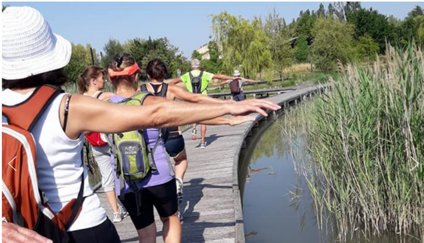
Sport avec l'Asl du lac de Montoux