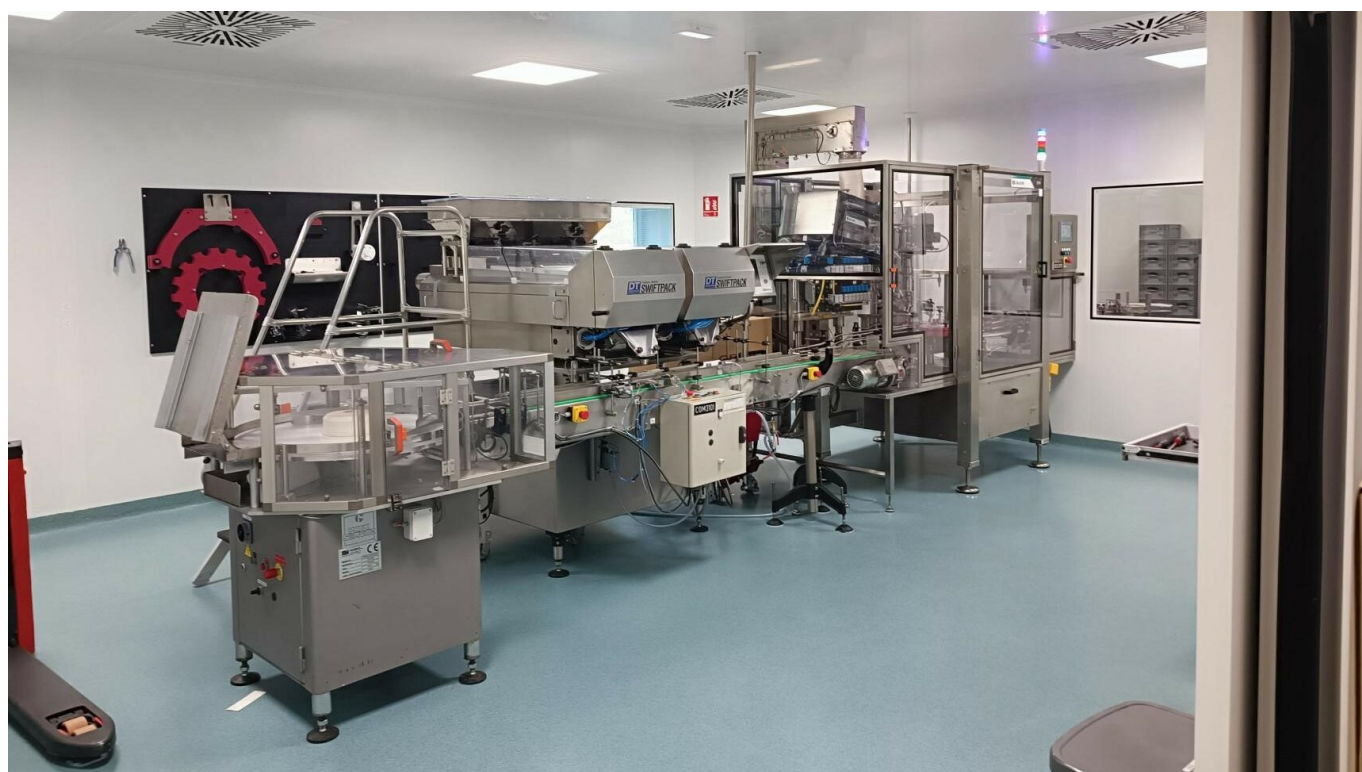
Chaîne de production Keriens 3