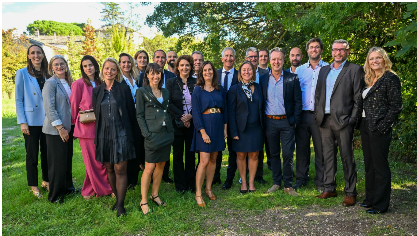
l'équipe Mayoly de l'Isle sur la Sorgue.