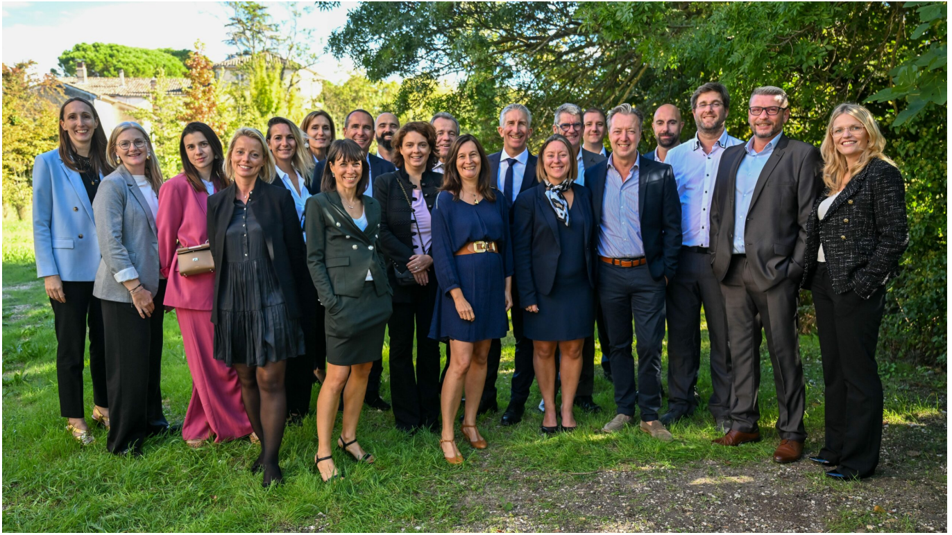
l'équipe Mayoly de l'Isle sur la Sorgue.