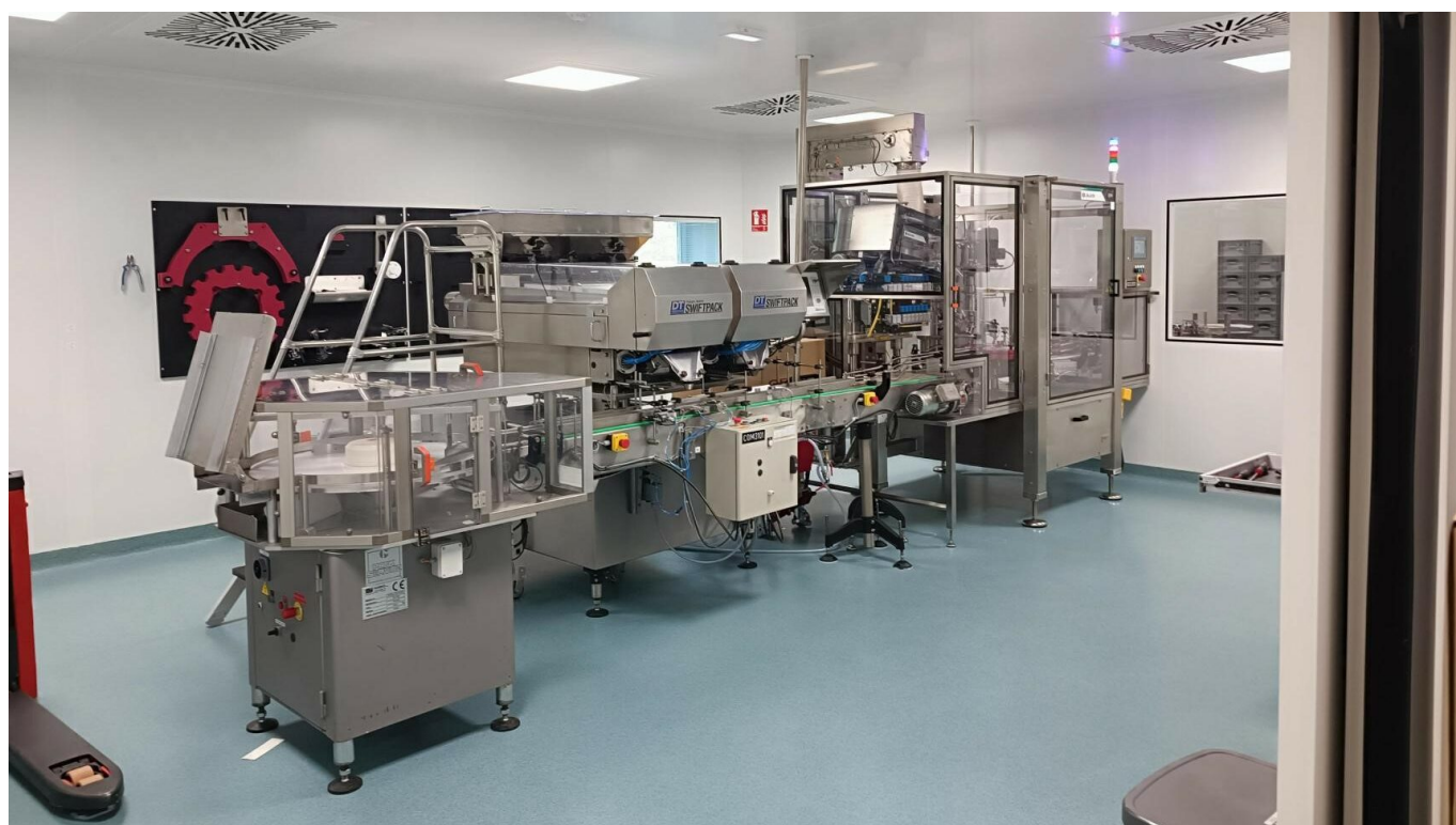
Chaine de production Kersiens 3