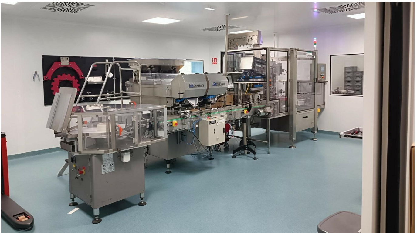
Chaîne de production Keriens 3