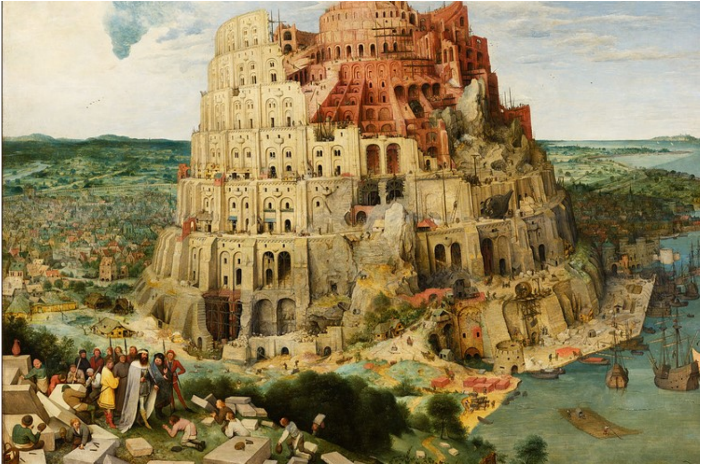
La tour de Babel