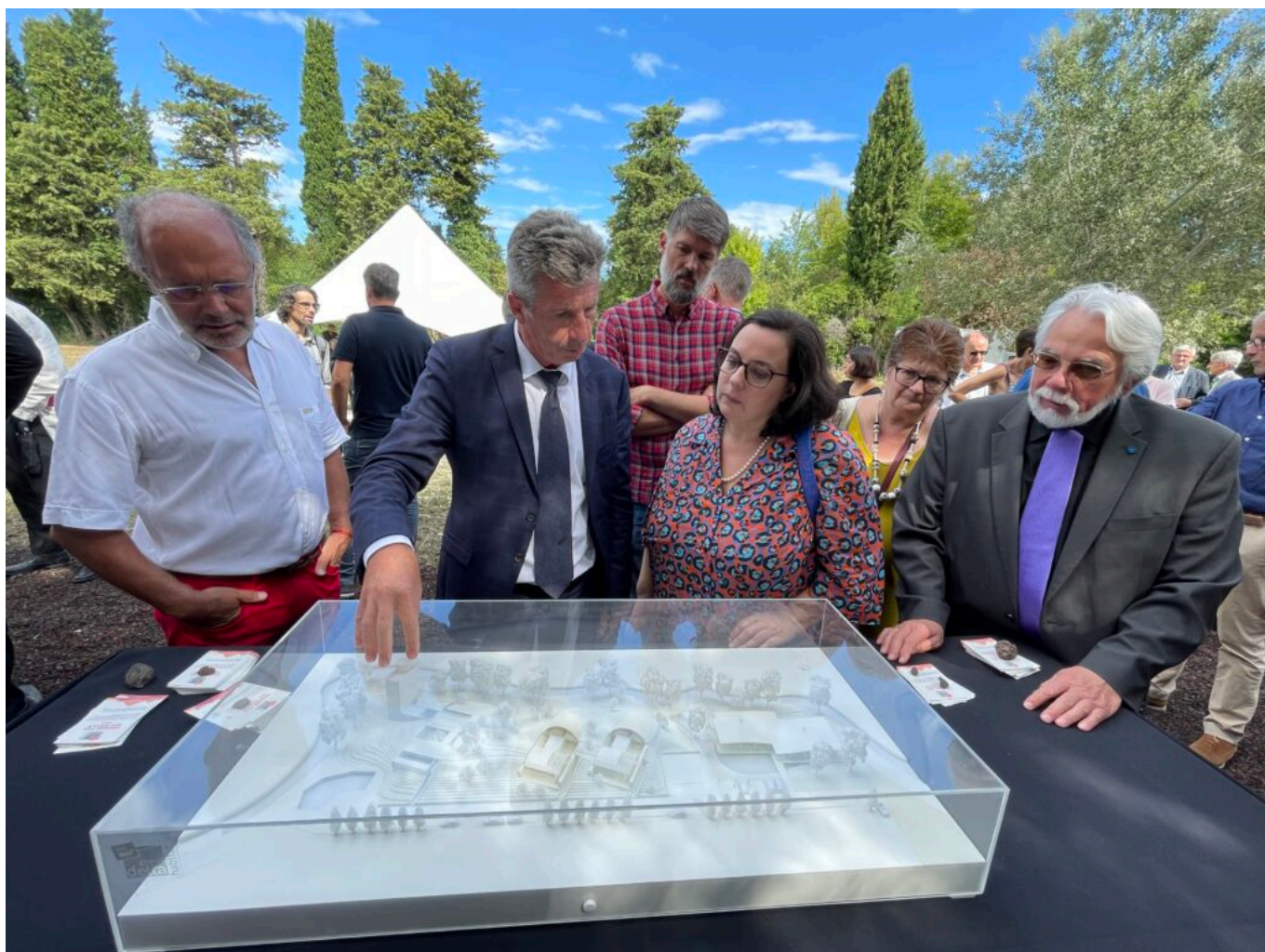
La présentation du projet par les architectes sur le terrain dévolu au projet Seul sur Mars