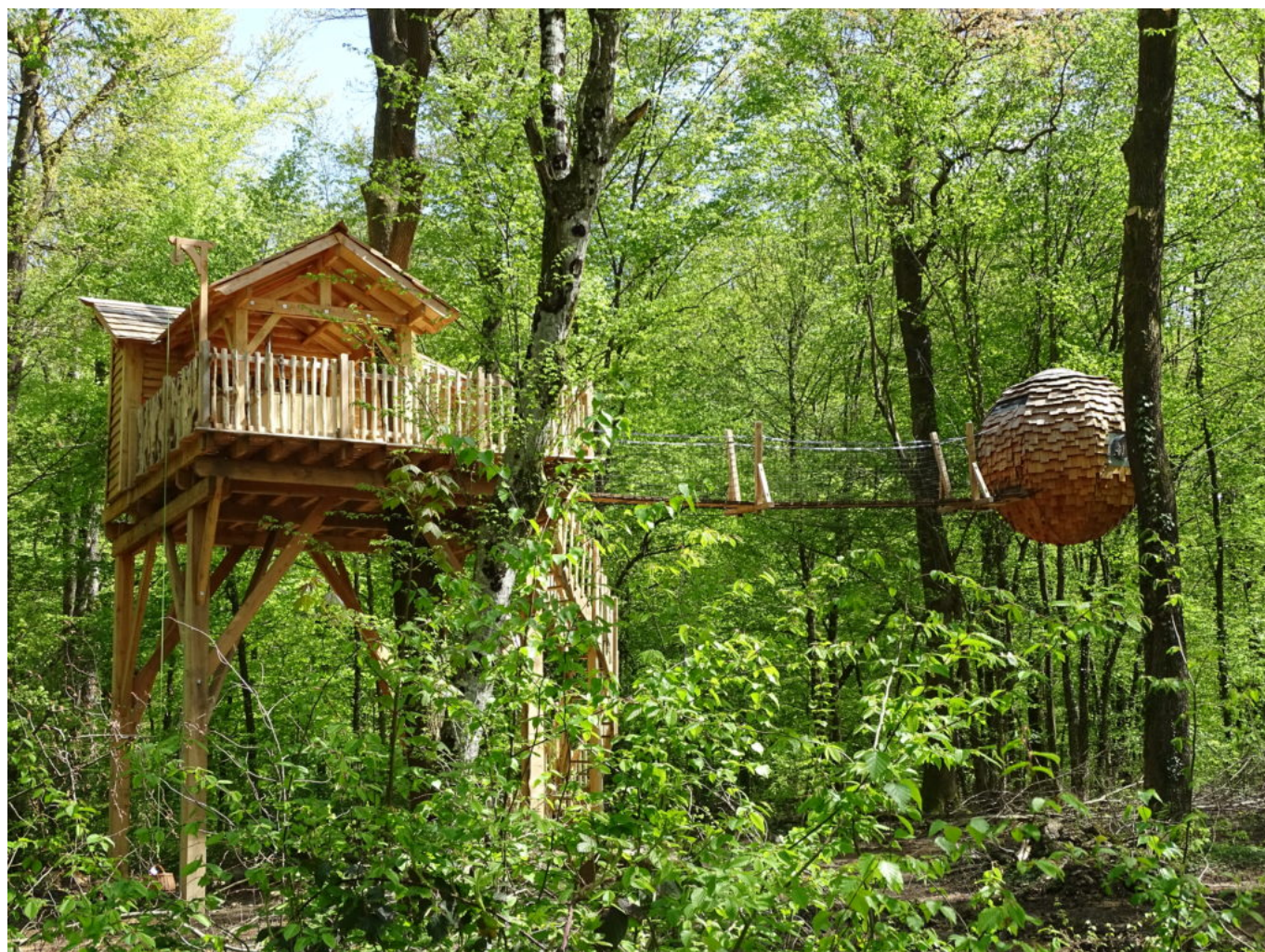
Cabane grands chênes