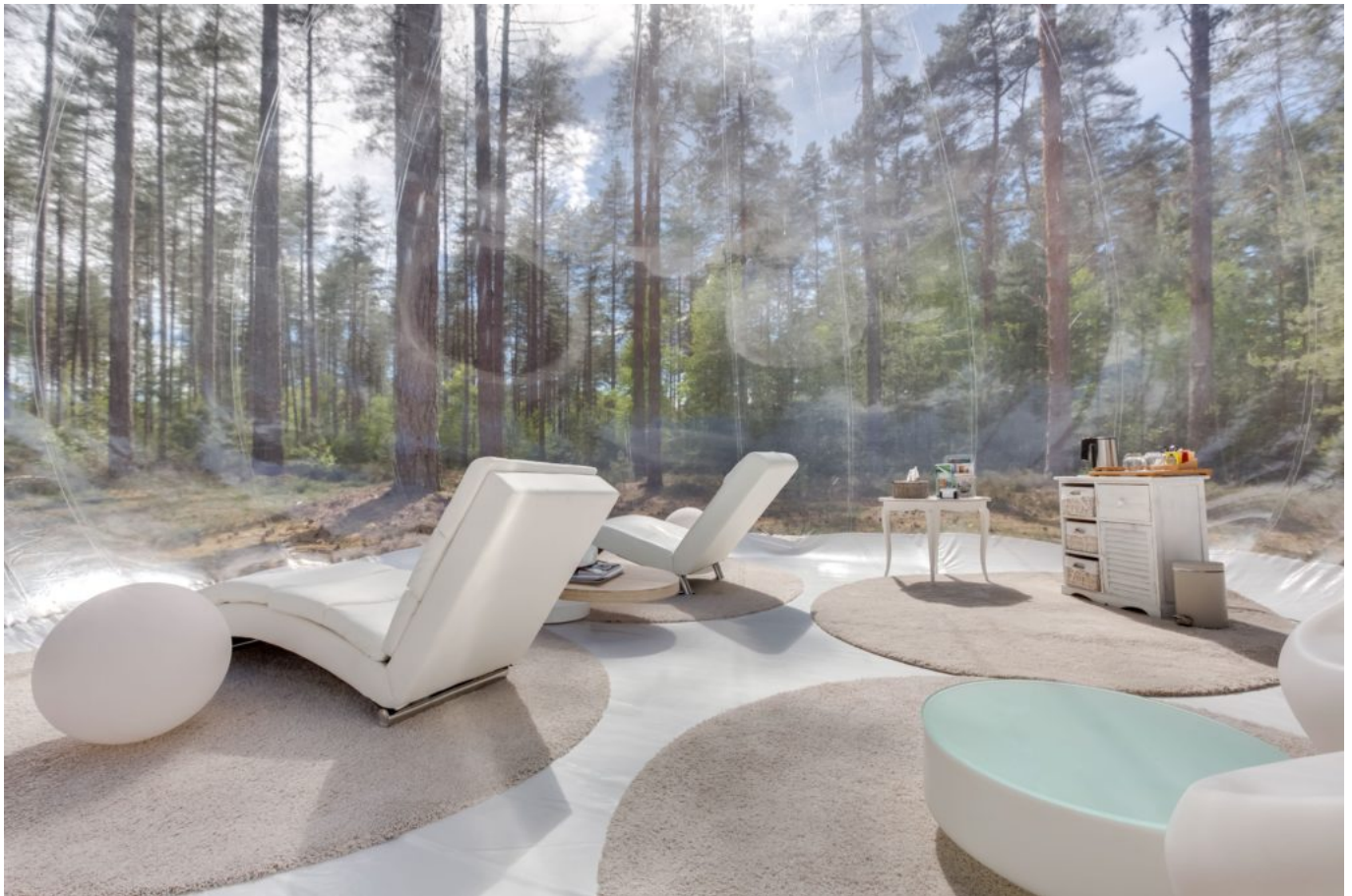
Bulle de cristal