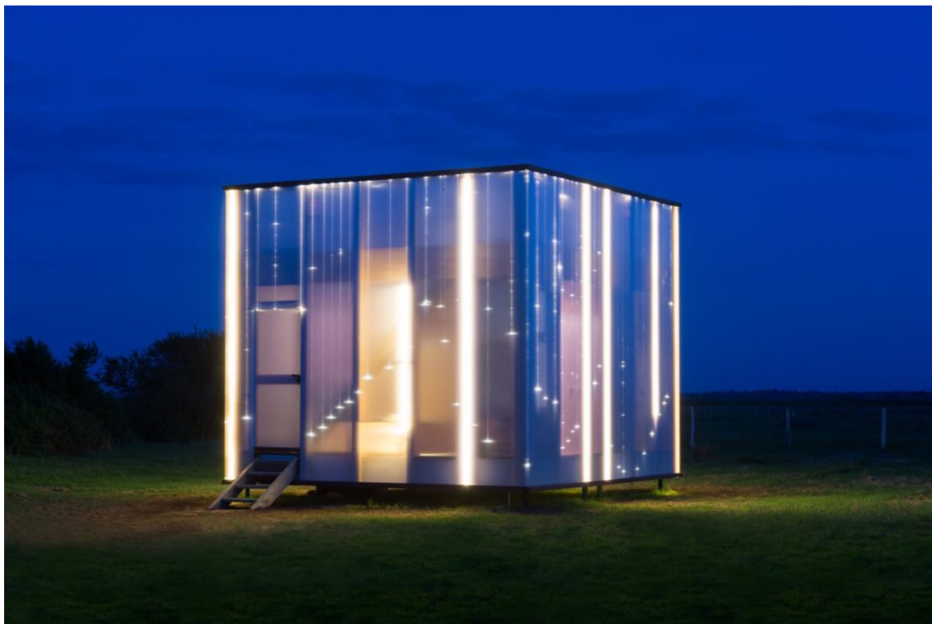
La Bienvenueuse, Lavau-Sur-Loire

Cette réactivité de la part du leader français de l'hébergement insolite lui a permis de connaître une explosion des réservations au printemps et à l'été. « Nous avons fait deux fois et demie le chiffre d'affaires de l'année précédente. Nous avons quasiment rattrapé notre retard, tout s'est concentré sur quelques mois », poursuit le fondateur. Le panier moyen quant à lui connaît une croissance de 4% en 2020. L'impact du deuxième confinement a, lui, été sauvé par la vente de bons et cartes cadeaux pour Noël.