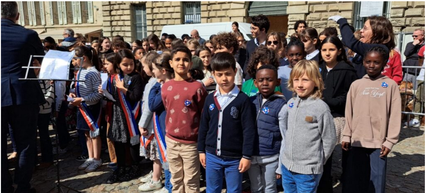
Les enfants des écoles Bouquerie et Mistral