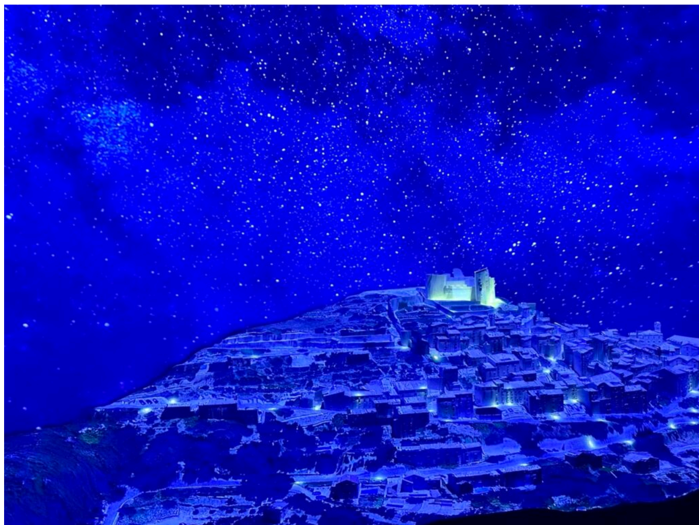
Maquette du village de Lacoste