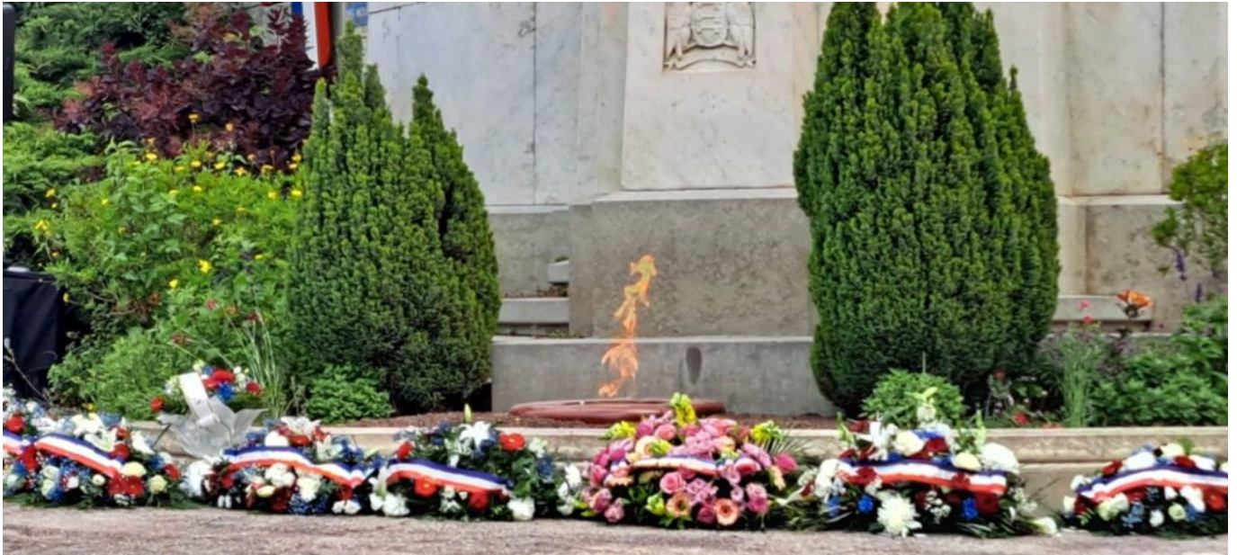
Réanimation de la flamme à la mémoire des victimes de la guerre