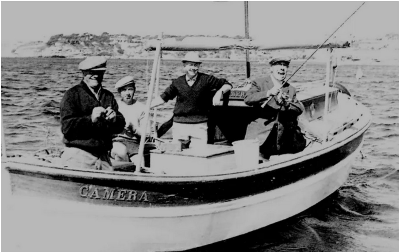
Fernandel (à droite), lors d'une de ses sorties de pêche au large de Carry-le-Rouet.