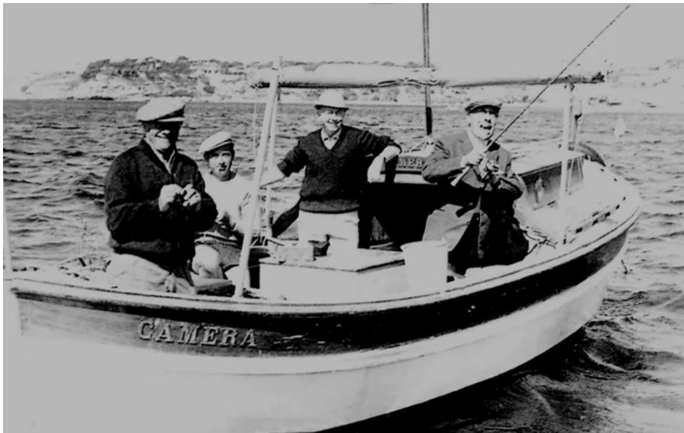
Fernandel (à droite), lors d'une de ses sorties de pêche au large de Carry-le-Rouet.