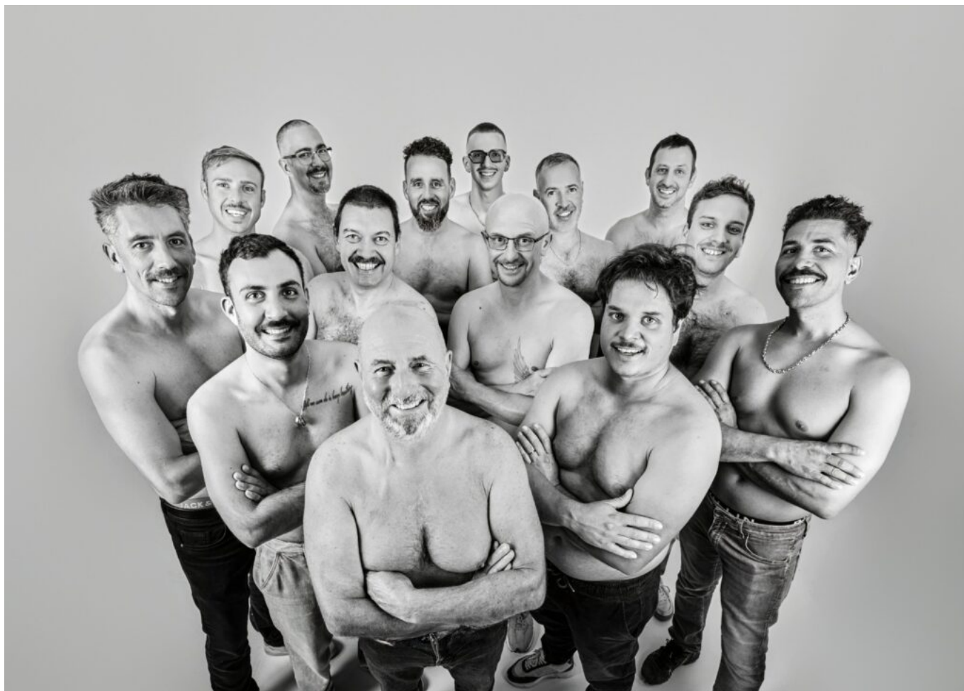
Movember Les hommes de l'Amac