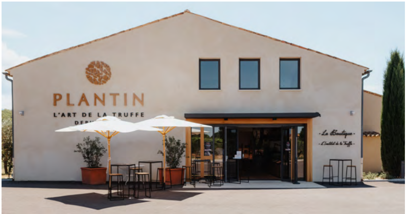
La boutique et l'Institut de la truffe

même en jus. Et aussi les champignons séchés : Morilles, Ceps, Girolles, Trompettes de la mort, bolets jaunes, shiitakés et mélanges forestiers. Dans les rayons de l'épicerie fine on trouve les huiles, vinaigres, sels, apéritifs et tartinables, condiments, sauces et préparations... à la truffe. Également des douceurs sucrées et des plats gastronomiques toujours à base du diamant noir ou blanc.