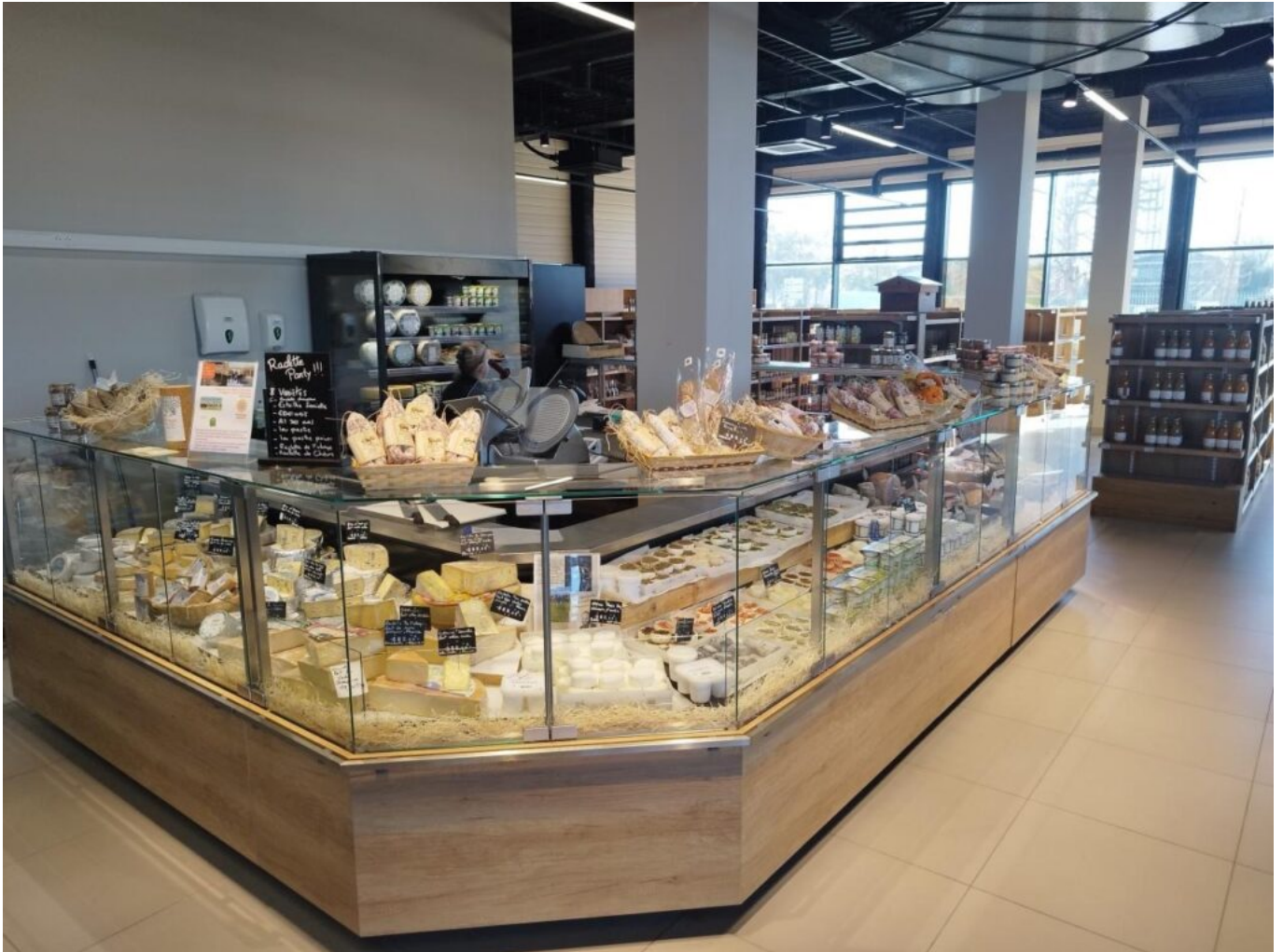
Un stand à la coupe est proposé en charcuterie et en fromage