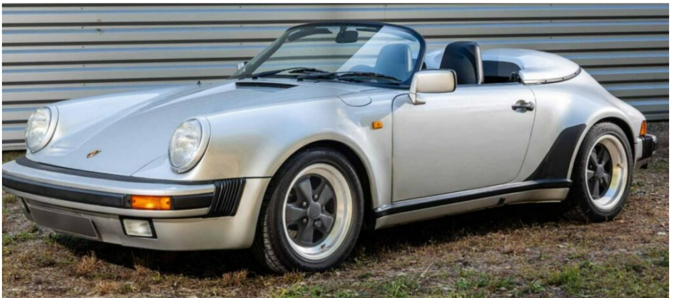
Porsche 911 Carrera