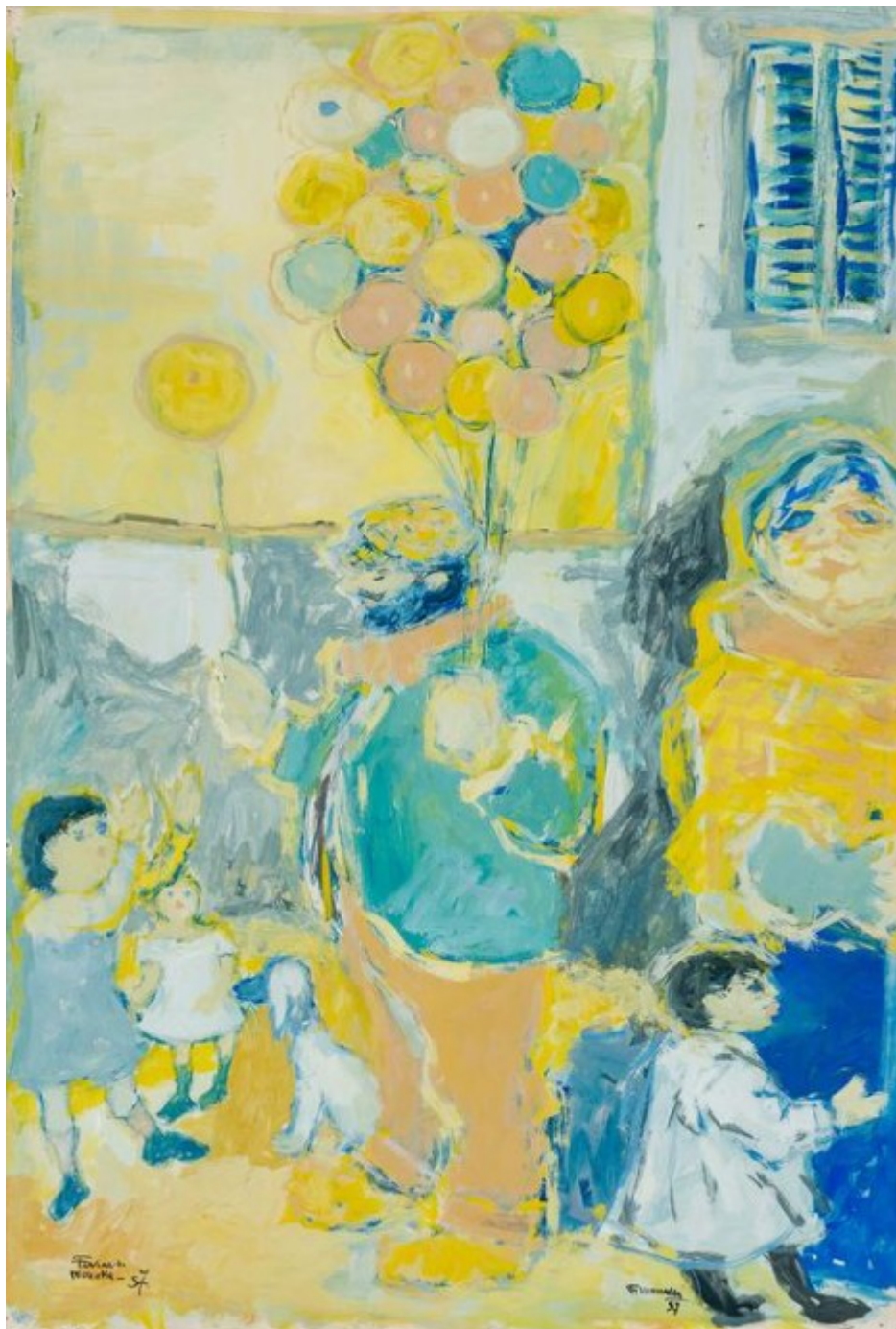
Fikert Moualla, le vendeur de ballons