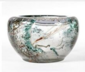
Emile GALLE (1846-1904) : " Les anisoptères " 1882. Rare et exceptionnelle coupe balustre évasée à large col annulaire rentrant. Epreuve en cristal soufflé au riche décor...