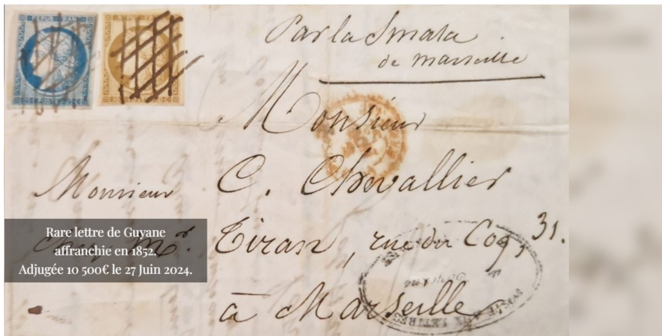
Rare lettre de Guyane affranchie en 1852. Adjudée 10 500€ le 27 Juin 2024.