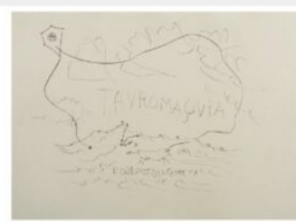
Pablo PICASSO (1881-1973): Jose DELGADO alias Pepe Illo - LA TAUROMAQUIA