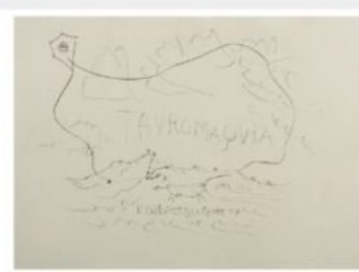
Pablo PICASSO (1881-1973): Jose DELGADO alias Pepe Illo - LA TAUROMAQUIA