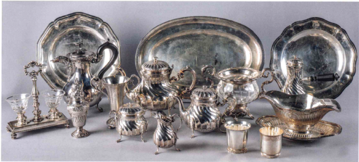
D'UN ENSEMBLE DE PIÈCES D'ORFÈVRE dont plats et pièces de forme en argent. Époques XIXe et XXe.