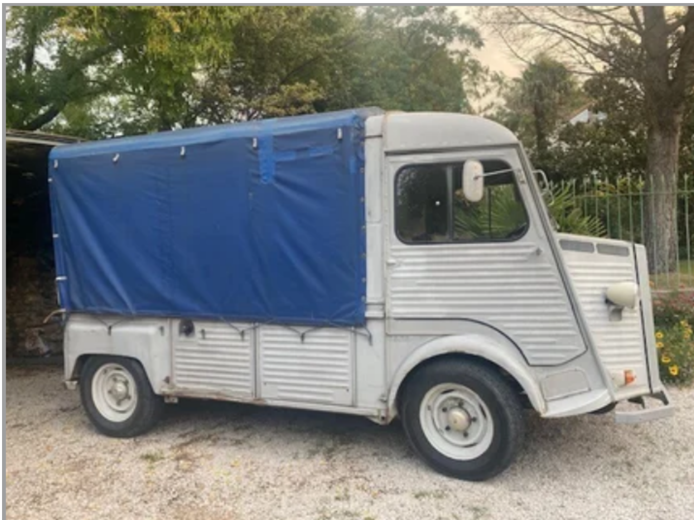
Citroën pick up d'avril 1978