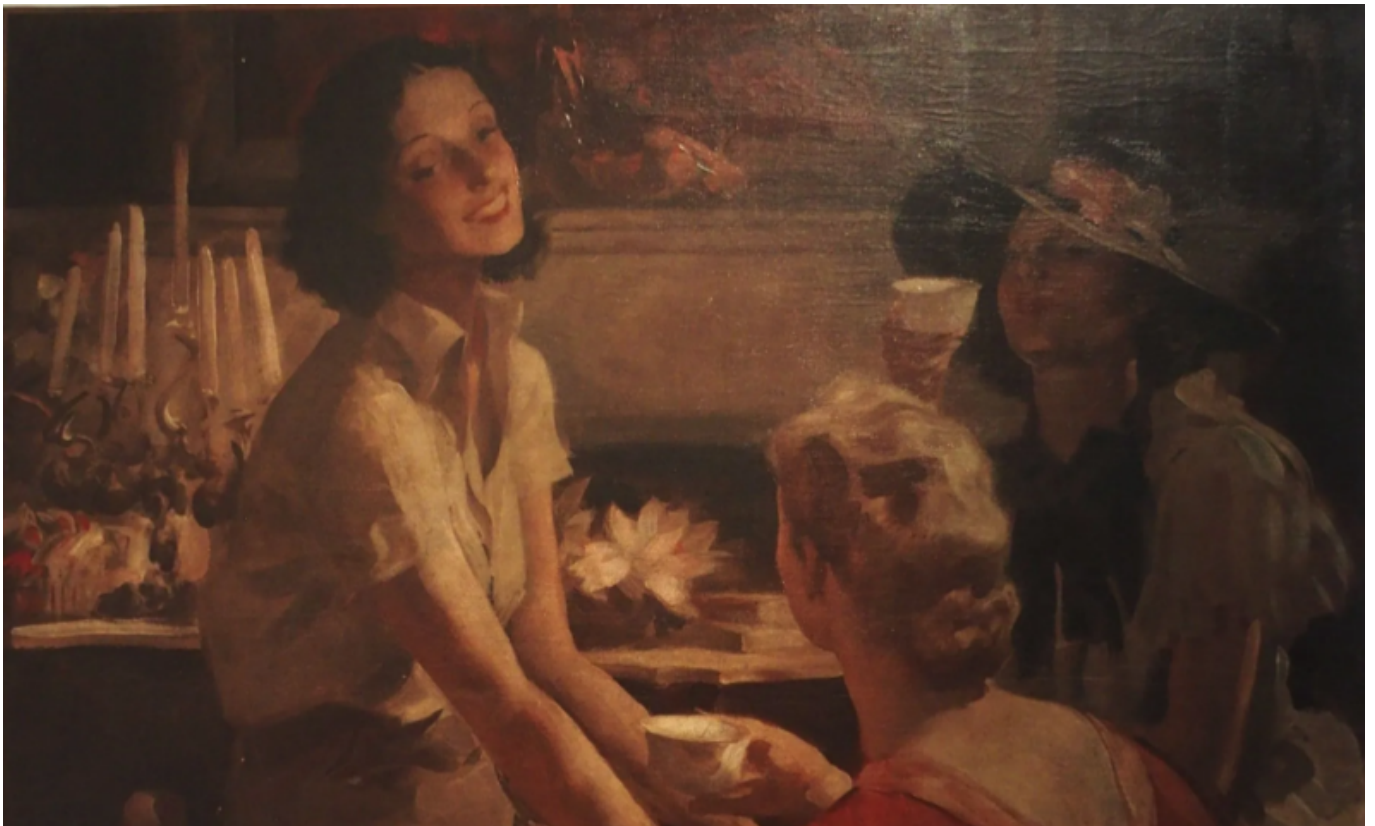
tableau attribué à William James Glakens (1870-1938)