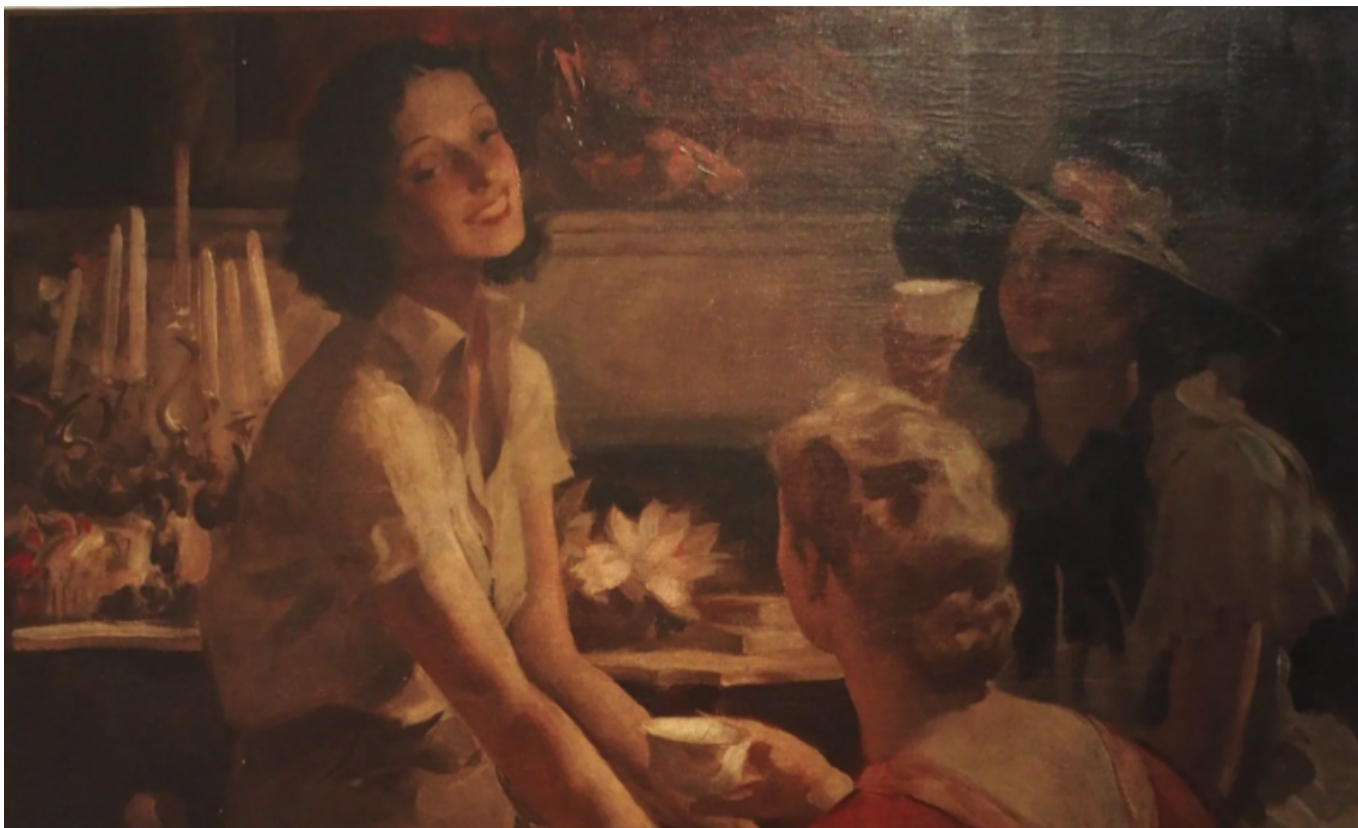
tableau attribué à William James Glakens (1870-1938)