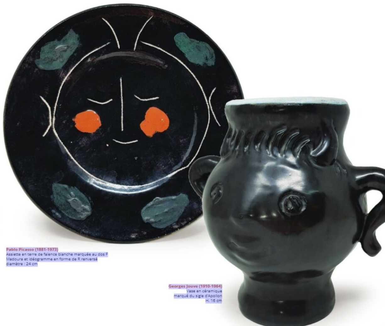
Pablo Picasso (1881-1973) Assiette en terre de faïence blanche marquée au dos F Madoura et idéogramme en forme de R renversé diamètre : 24 cm