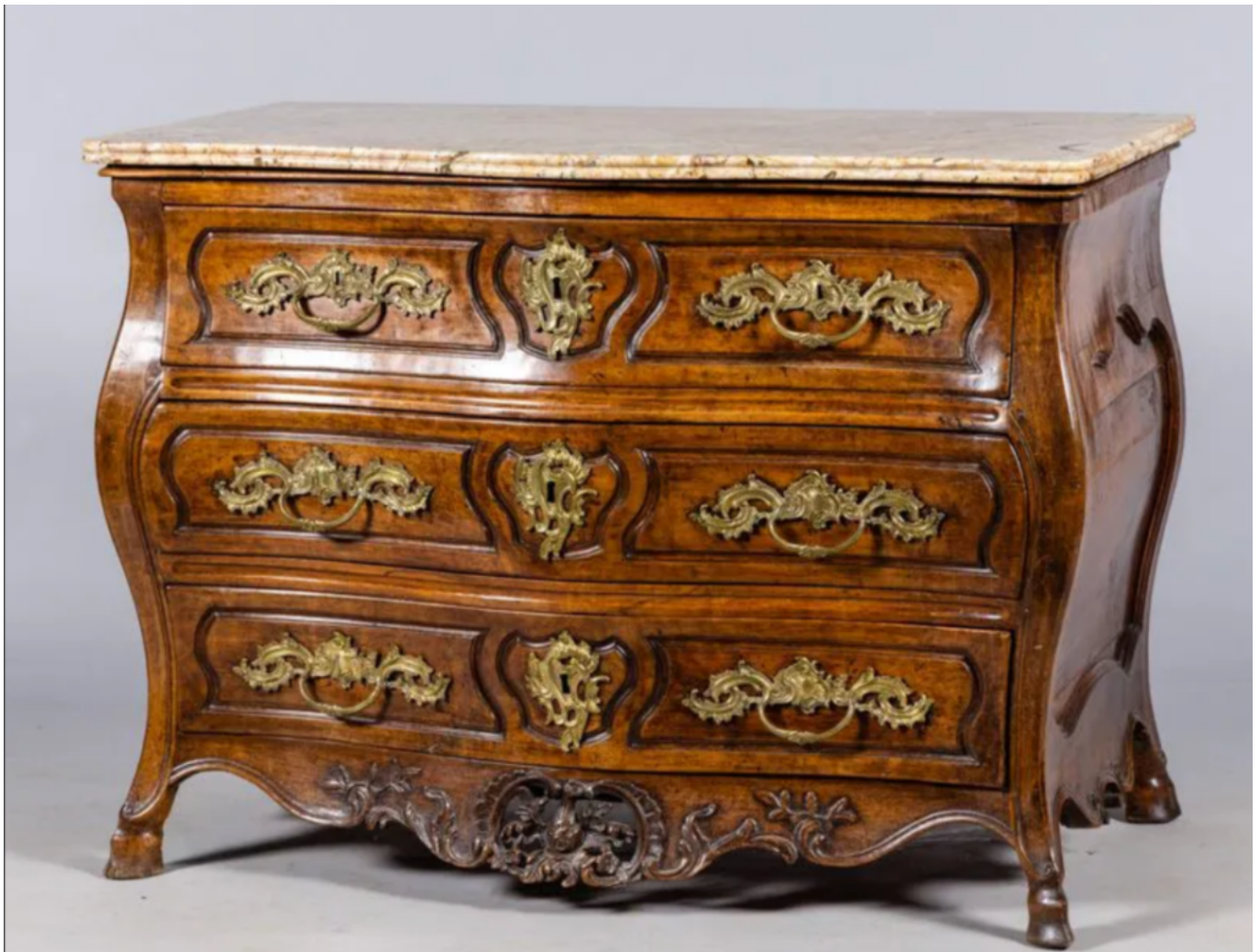
Commode tombeau en noyer et son plateau en marbre

Hôtel des ventes d'Avignon . Samedi 27 novembre 2021 de 10h à 14h. Exposition le matin de la vente de 9h à 10h. Prochaine vente samedi 11 décembre : vins et alcools. Catalogue et renseignements sur www.avignon-encheres.com et sur www.interencheres.com/84001 Patrick Armengau, commissaire-Priseur. Courtine. 2, rue Mère Teresa à Avignon. 04 90 86 67 61. La plaquette illustrée ici . Catalogue de vente ici .