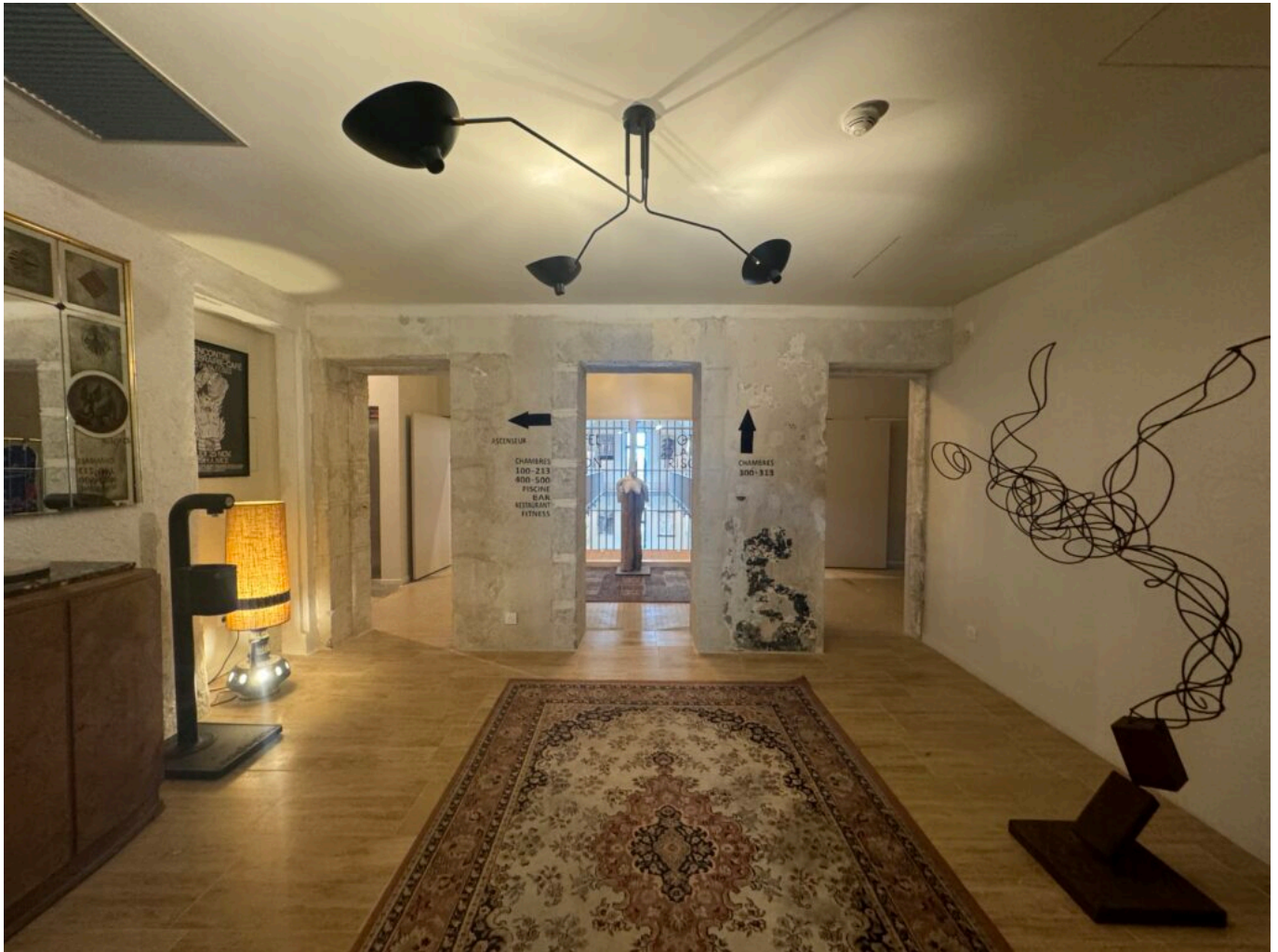
L'intérieur de l'Hôtel La Prison

toiles, des tableaux, des tapis, des canapés colorés et des meubles chinés dans toute la France créent une ambiance chaleureuse. Même principe dans les parties communes ! Des pièces d'artistes telles qu'un Alien dans la cour ou les six joueurs de babyfoot géants de Monsieur Pierre Baey ont été intégrées.