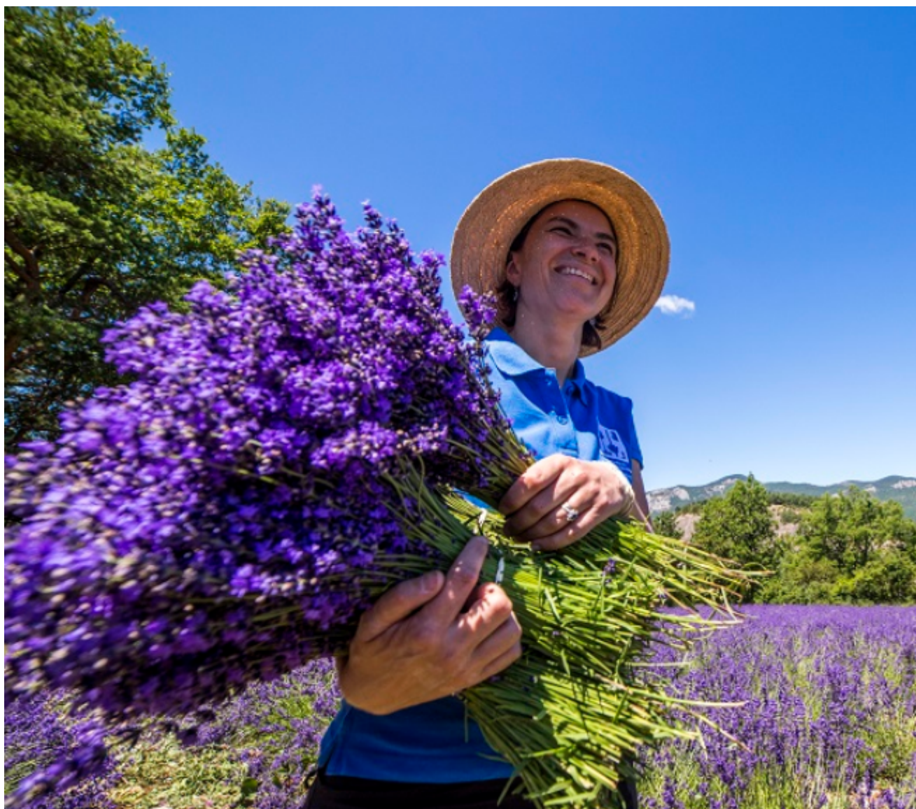
Cueillette de la lavande