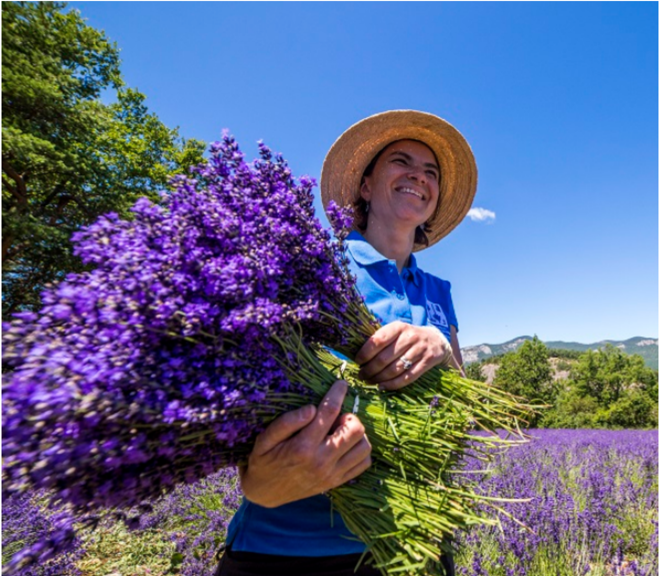
Cueillette de la lavande