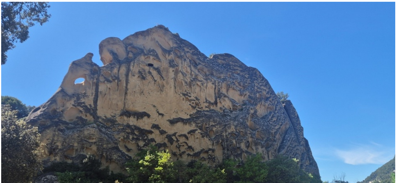
Le rocher de Rocalinaud.

Dominique Santoni , Présidente du Conseil départemental de Vaucluse, était présente sur le terrain la semaine dernière pour découvrir cette nappe, en présence de nombreux acteurs concernés par cette problématique. Le rocher de Rocalinaud à Beaumes-de-Venise est un vestige d'une dune sous-marine, représentative d'un type de structure présent dans cette nappe du miocène où l'eau est piégée entre les grains de sable. Elle constitue la principale ressource en eau potable du département. L'objectif pour tous les acteurs concernés par la ressource en eau, à commencer par le Conseil départemental, est de connaître la ressource réelle en eau de cette nappe qui n'est pas illimitée mais également de pouvoir quantifier son niveau avec une plus grande précision.