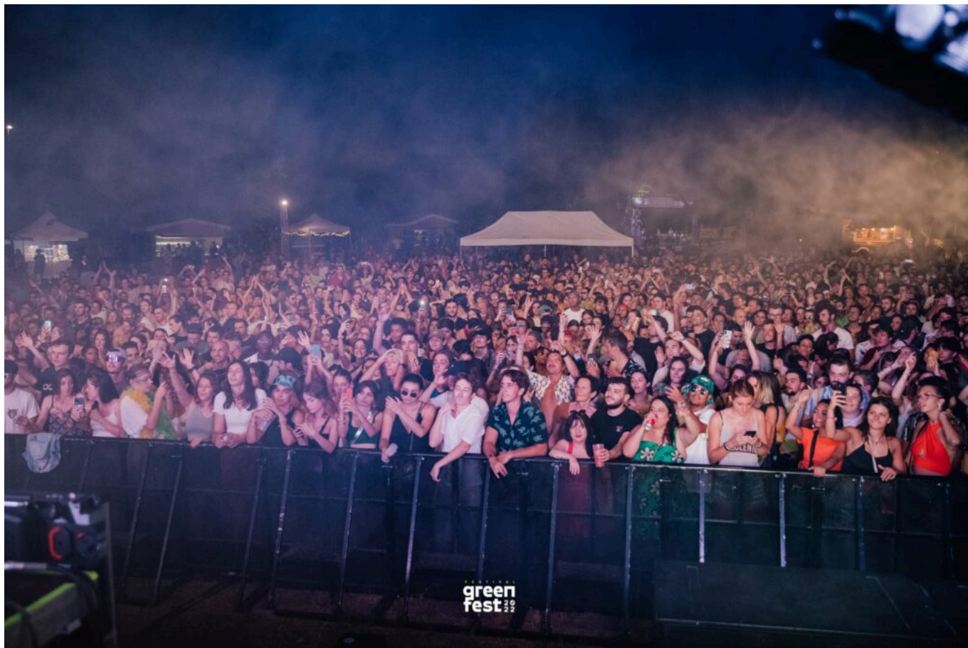
En 2022, le festival Green Fest a accueilli 3 000 personnes