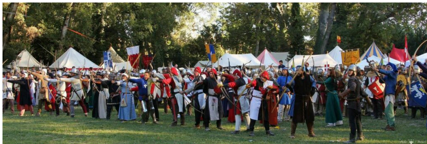
Festival médiévale de la Rose d'Or édition 2021

Le prix d'entrée est de 5 € pour les visiteurs de plus de 12 ans. Sur place, toutes les activités seront gratuites et une taverne médiévale fournira, à un prix modique, boissons et repas.