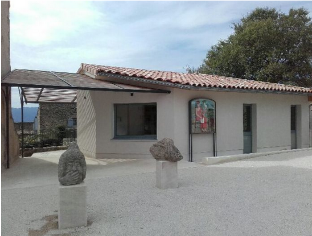
La mairie de Viens à Saint-Martin-de-Castillon