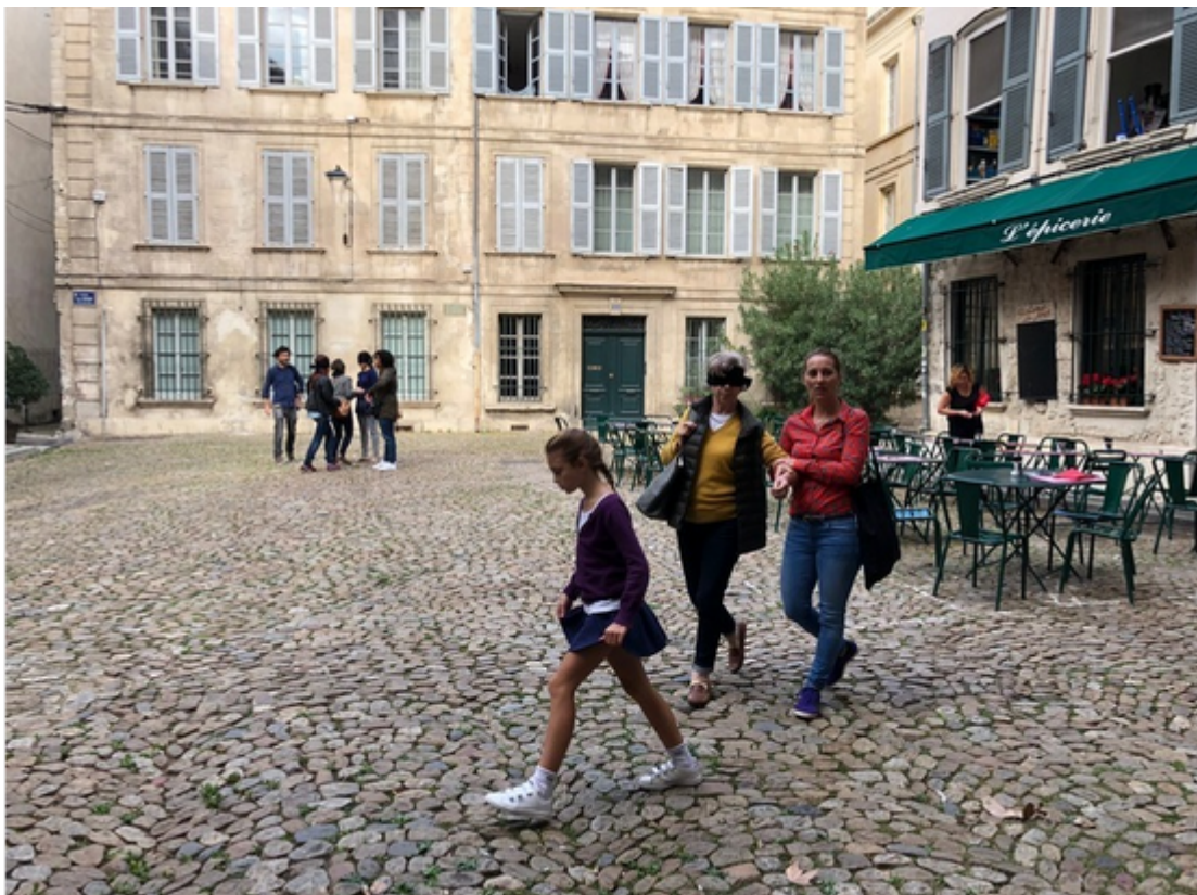
Balade les yeux bandés

Rendez-vous pour le départ au square Saint-Didier à 14h15. La balade se termine au Rocher des Doms.