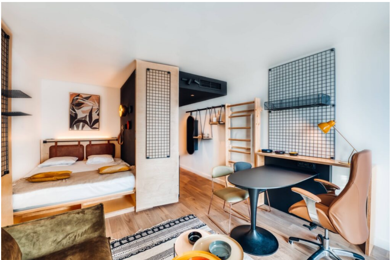
Un exemple de 'flex appart' que l'on peut retrouver à Cowool.