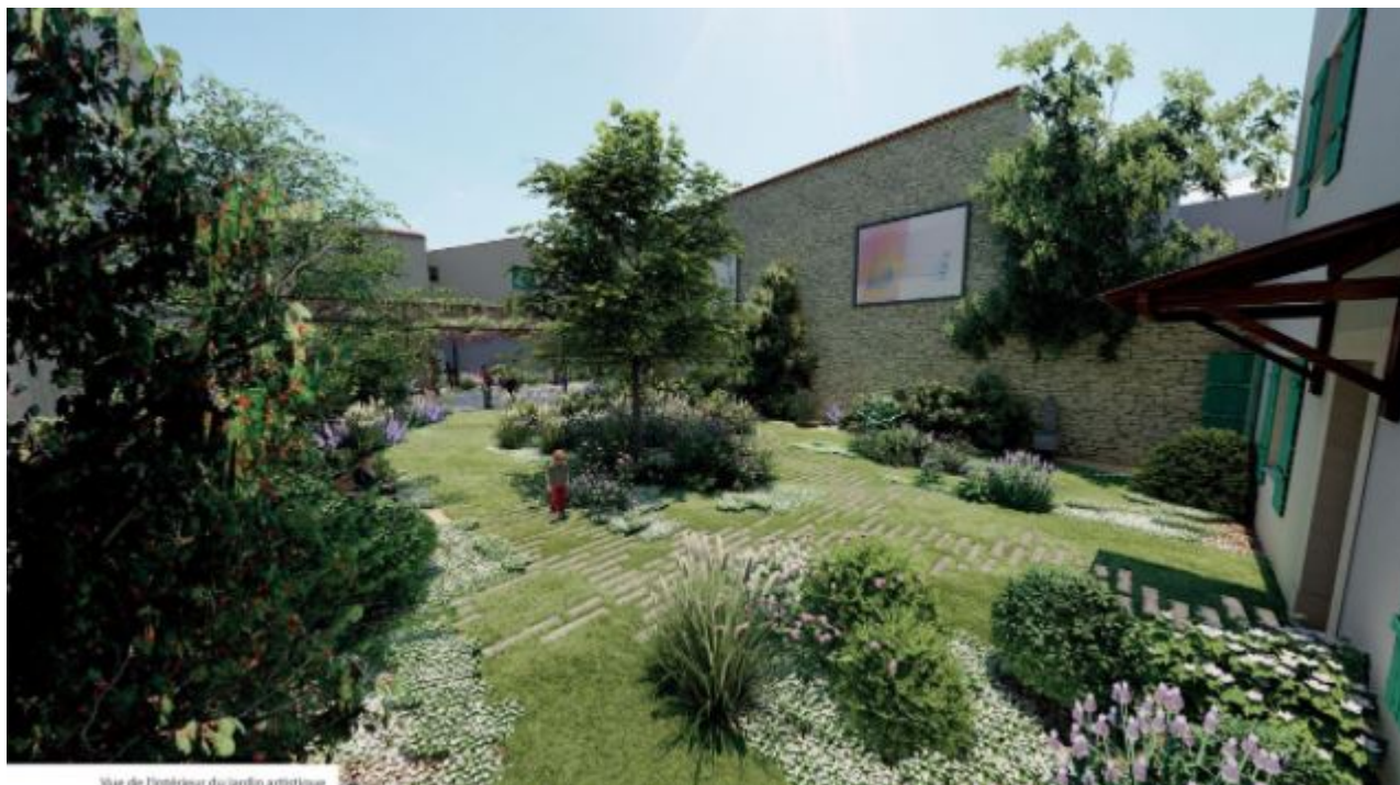
Vue de l'intérieur du jardin artistique

grands musées de France. Cette initiative est pilotée par le Musée de la Villette. A côté de ce musée numérique, sur tout l'îlot adjacent à la Boutique actuelle, seront installés : un atelier numérique avec des équipements informatiques, un espace de réalité virtuelle, des associations, la Mission Locale, un point d'Information jeunesse, une salle de réunion, etc. Au fond du jardin artistique, il est envisagé d'installer l'école de musique. Son déménagement de la salle de la Vannerie permettra d'accueillir le Musée de l'école d'autrefois.