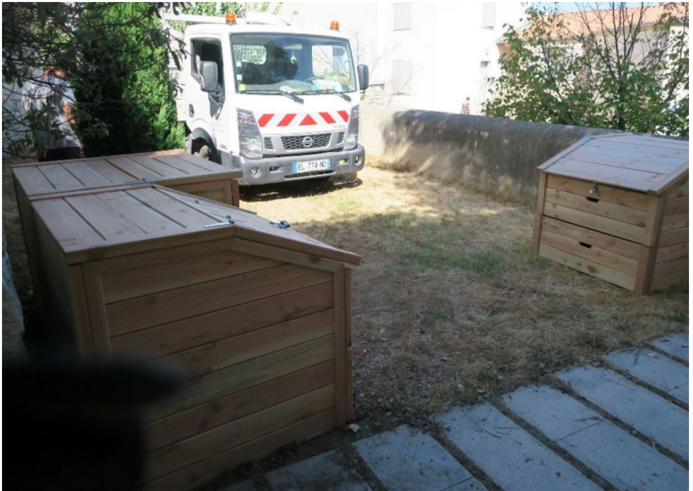
Site de compostage partagé rue de saillon