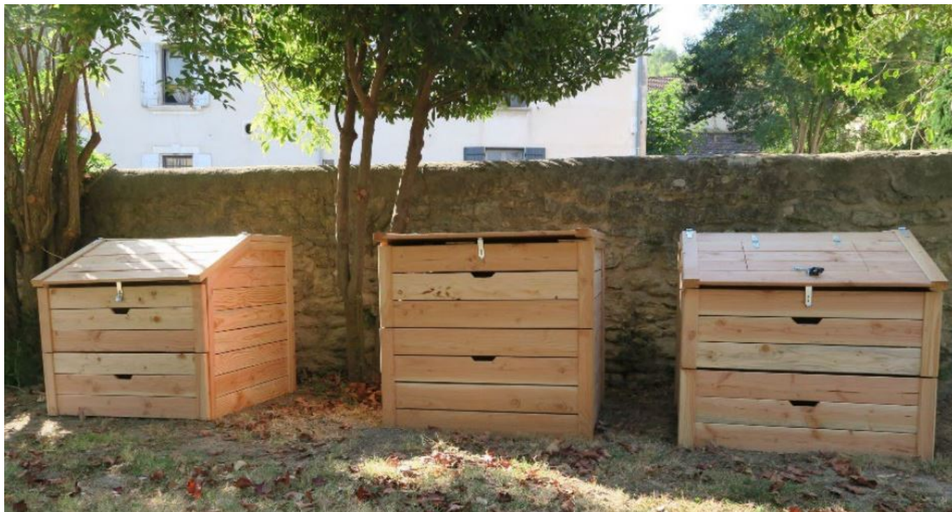
Site de compostage partagé salle des fêtes