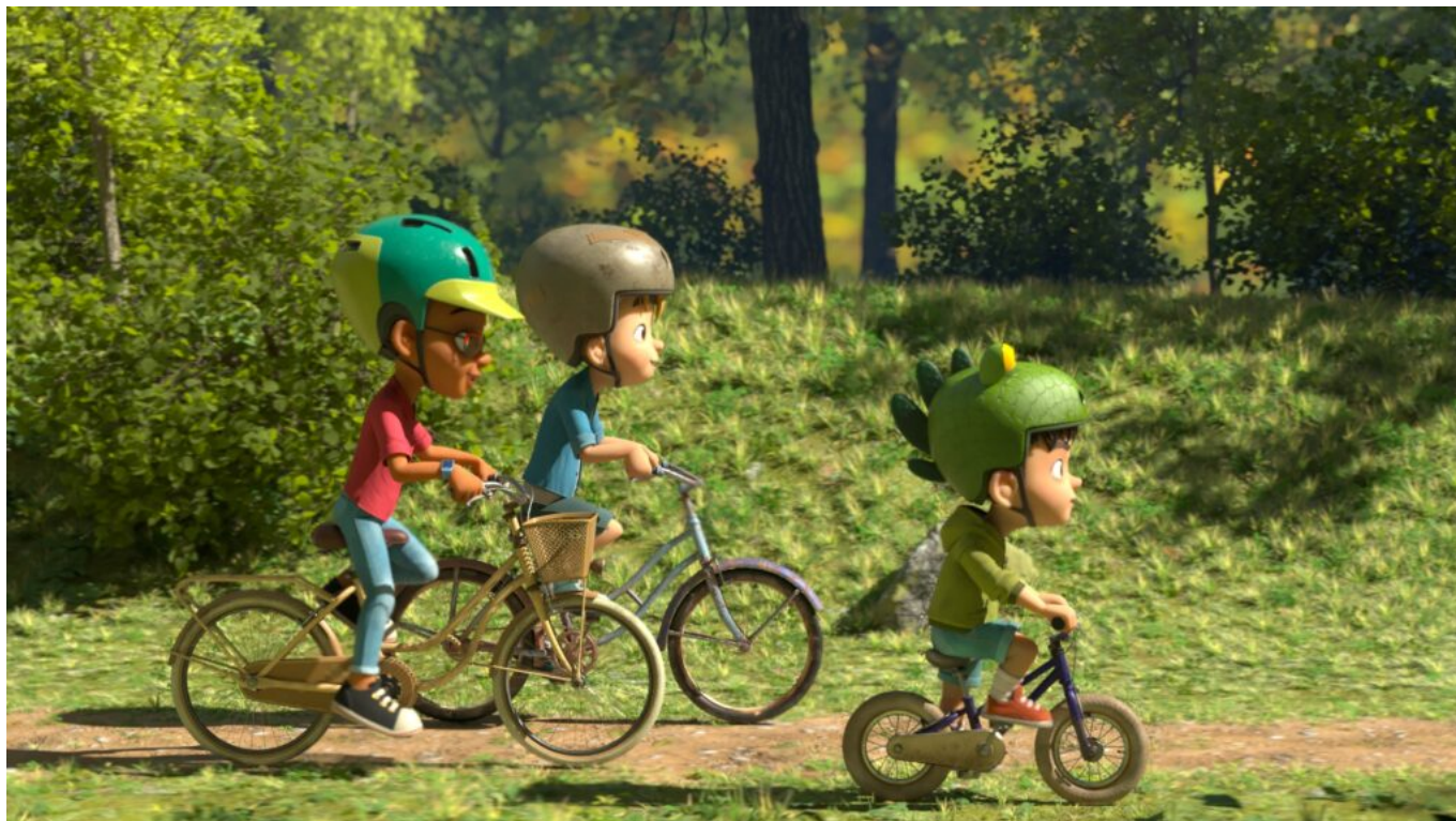
Partie de Campagne

Plus qu'un soutien, Loïc Etienne accompagnera le studio Station animation dans toutes les démarches jusqu'au choix des locaux. Installé dans des locaux de 150 mètres carré au cœur du centre-ville, la société dispose de tous les aménagements pour accueillir la quinzaine de modelleurs, 'textureurs' et quelques 'setuiseurs' qui travaillent au quotidien pour le studio.