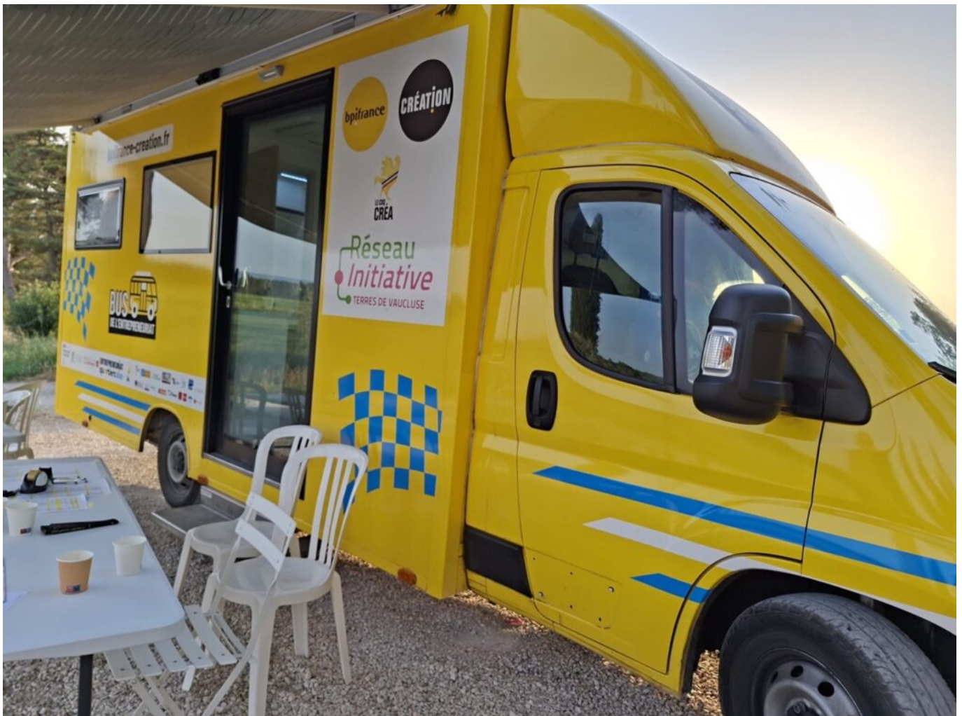
Le bus qui quadrille le Vaucluse.

Initiative Terres de Vaucluse maille le territoire avec 9 lieux d'accueil, Avignon, Apt, Orange, Sorgues, La Tour d'Aigues, Le Pontet, Cavailon, Bollène et Lourmarin Un bus jaune de l'entrepreneuriat sillonne aussi le département, au plus près du public, dans les quartiers prioritaires de la politique de la ville.