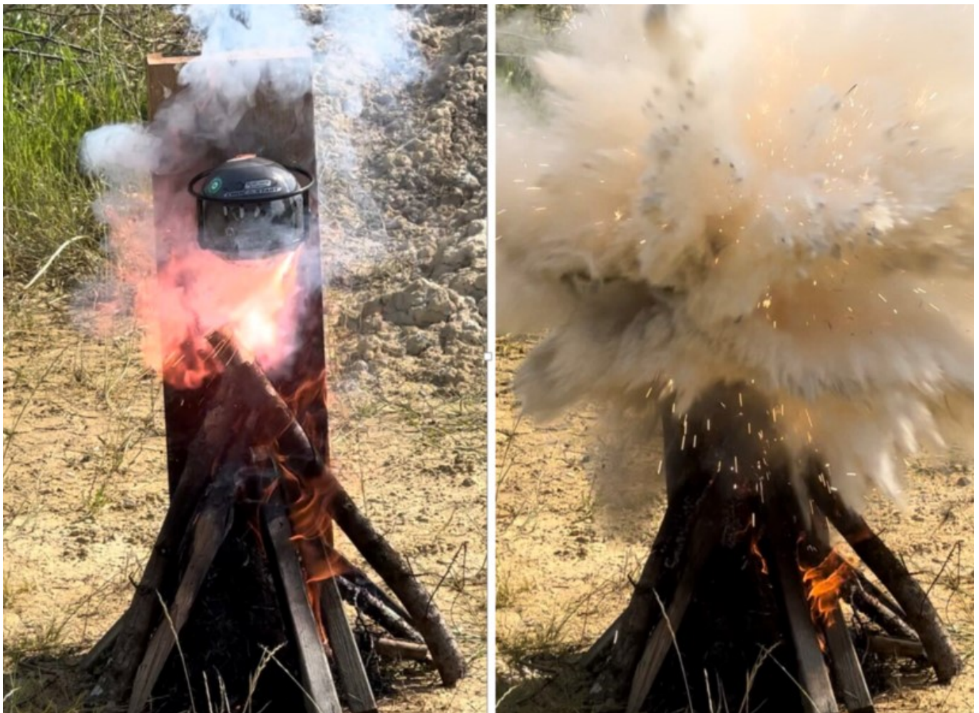
Le Block'Fire en situation réelle.

« Le Block'Fire représente en efficacité l'équivalent d'un extincteur de 2,5 kilos, alors que la boule ne pèse qu'1,3kg pour 15cm de diamètre. La boule extinctrice est munie d'une languette de sécurité que l'on retire et que l'on lance à proximité ou dans le feu, où elle éclatera à l'impact et éteindra le feu. Elle ne nécessite pas d'entretien ni de vérification comme c'est le cas pour les autres extincteurs. Au terme de 5-6 ans, alors que la durée de vie des extincteurs est de deux ans, vous ouvrez votre boule et vous fertilisez votre jardin, votre potager ou vos bacs de jardinerie avec son contenu.»