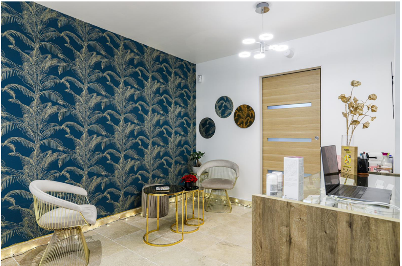
L'Institut 'Dermo Beauty by S' se situe 32 rue Proudhon à Tarascon.