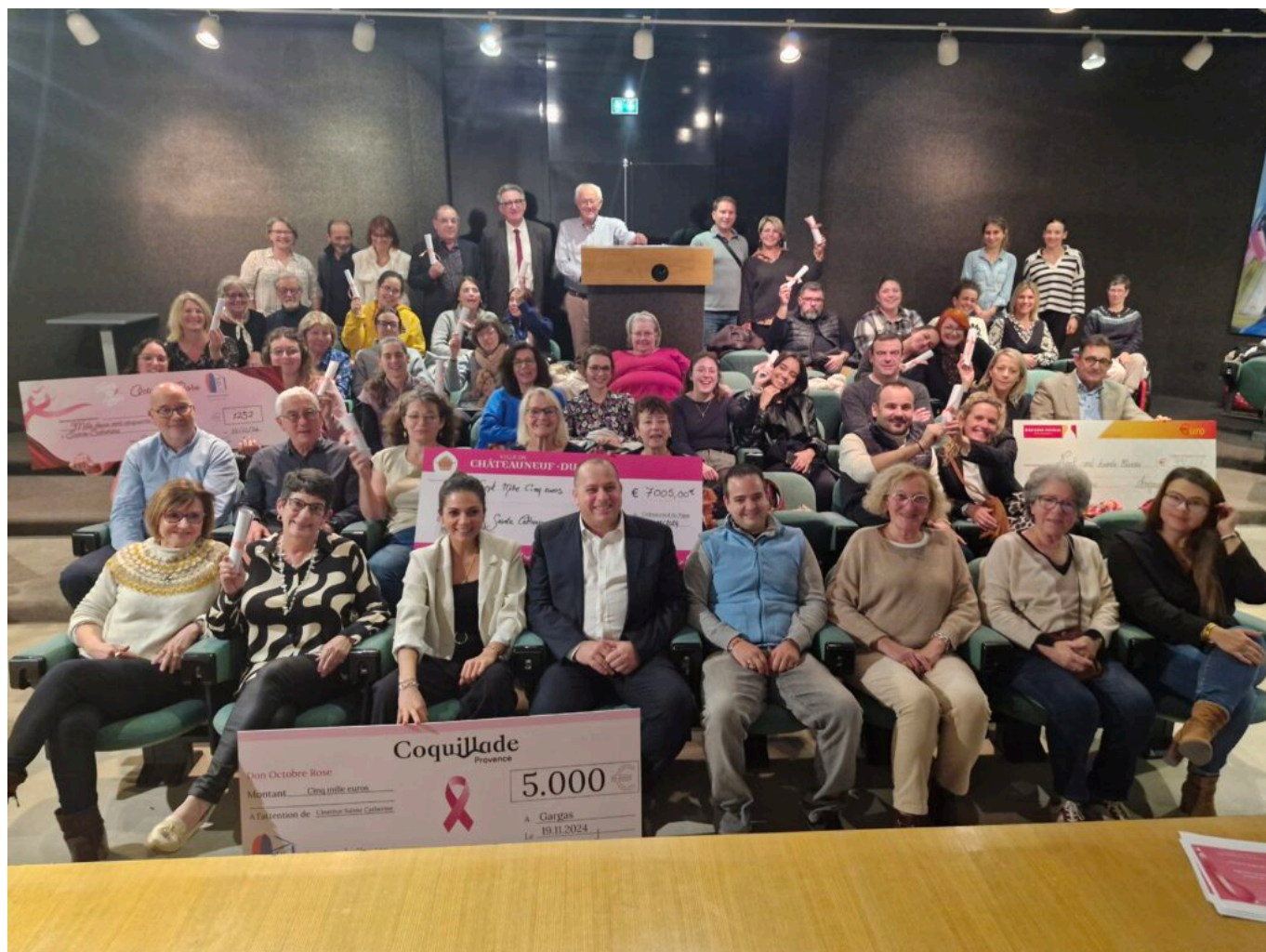
Remise des dons à l'Institut Sainte-Catherine Avignon