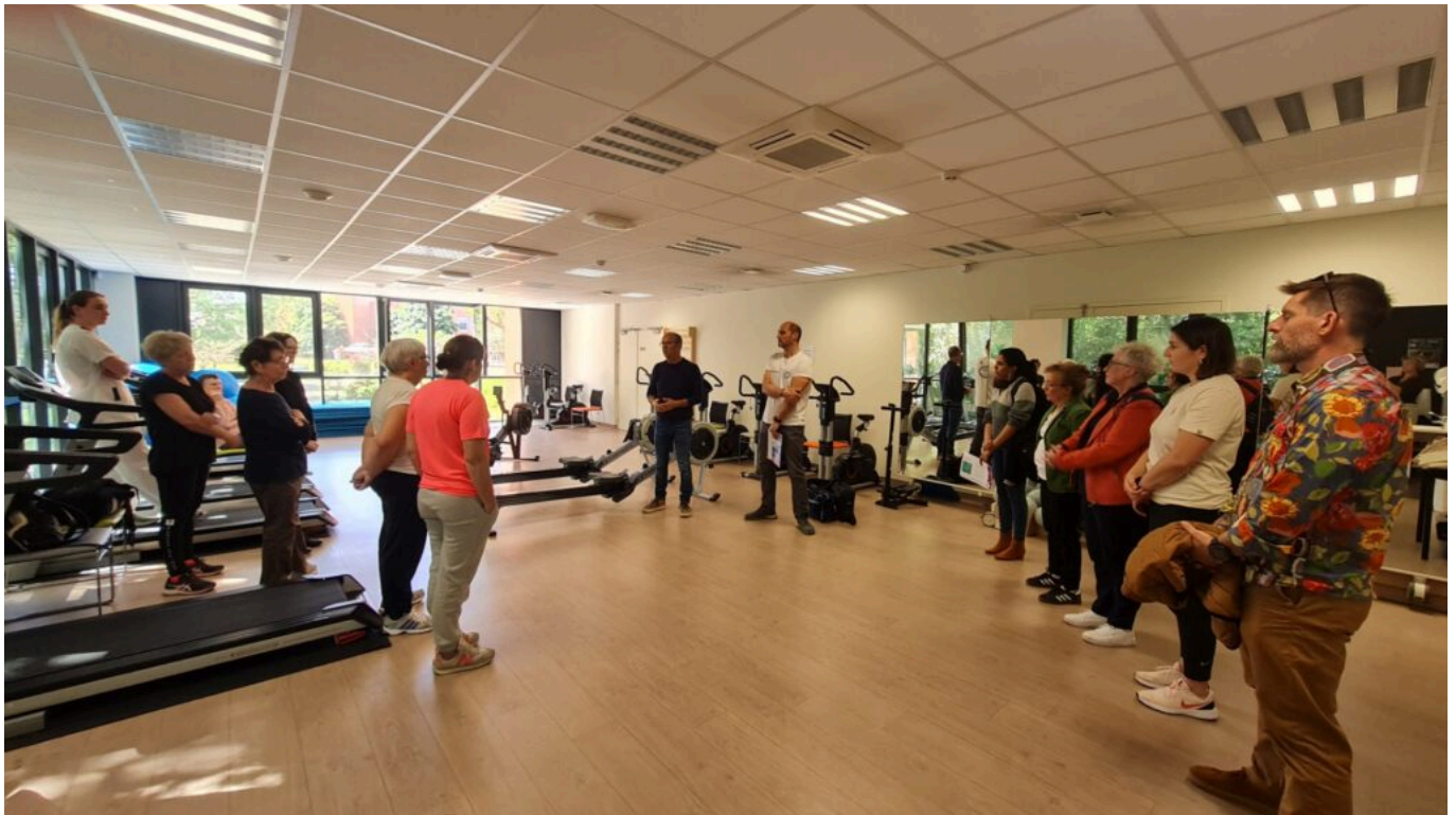
Présentation de l'activité aux patients de l'Institut.

Au programme de l'intervention du coach d'aviron, simulation de course mais surtout démonstration et précieux conseils pour utiliser de manière efficace la machine mise à disposition des patients. Pour ce sportif, responsable du pôle aviron santé, sa venue et son intervention ont également une portée pour la suite « on a un groupe au sein d'aviron santé dédié au dragon boat où on accueille déjà beaucoup de patientes et patients atteints ou guéris de cancers, ce que l'on souhaite c'est qu'il y en ait un maximum qui nous rejoigne. » annonce-t-il.