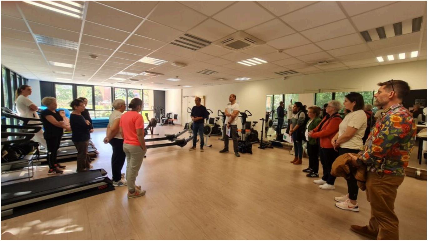
Présentation de l'activité aux patients de l'Institut.

Au programme de l'intervention du coach d'aviron, simulation de course mais surtout démonstration et précieux conseils pour utiliser de manière efficace la machine mise à disposition des patients. Pour ce sportif, responsable du pôle aviron santé, sa venue et son intervention ont également une portée pour la suite « on a un groupe au sein d'aviron santé dédié au dragon boat où on accueille déjà beaucoup de patientes et patients atteints ou guéris de cancers, ce que l'on souhaite c'est qu'il y en ait un maximum qui nous rejoigne. » annonce-t-il.