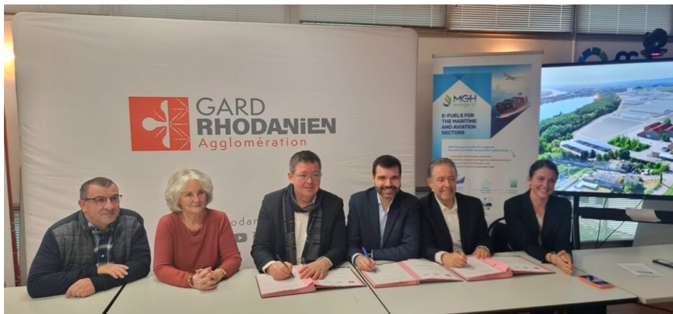
L'Agglomération a acté la reconversion industrielle du site de l'Ardoise ce lundi 9 février.