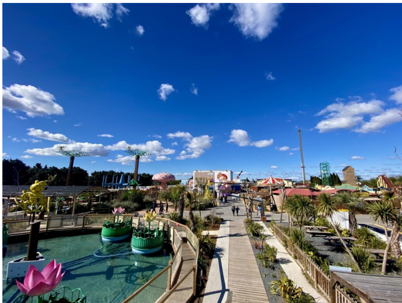
Vue d'ensemble du parc depuis la jungle tropicale des marsupilamis.

Pour se faire, la direction souhaite investir encore 18 millions d'euros sur les 4 prochaines années. Ce plan a plusieurs objectifs, non seulement pour le parc en lui-même, mais également pour le territoire dans lequel il se trouve : favoriser le recrutement dans le département, mais également faire du Vaucluse une destination davantage attractive pour les Français et les étrangers. Si la crise du Covid-19 a eu un certain impact sur l'affluence du parc qui n'a accueilli que 220 000 visiteurs en 2021, la direction vise 50 000 de plus cette saison grâce à la levée des restrictions, et davantage sur les années à venir.