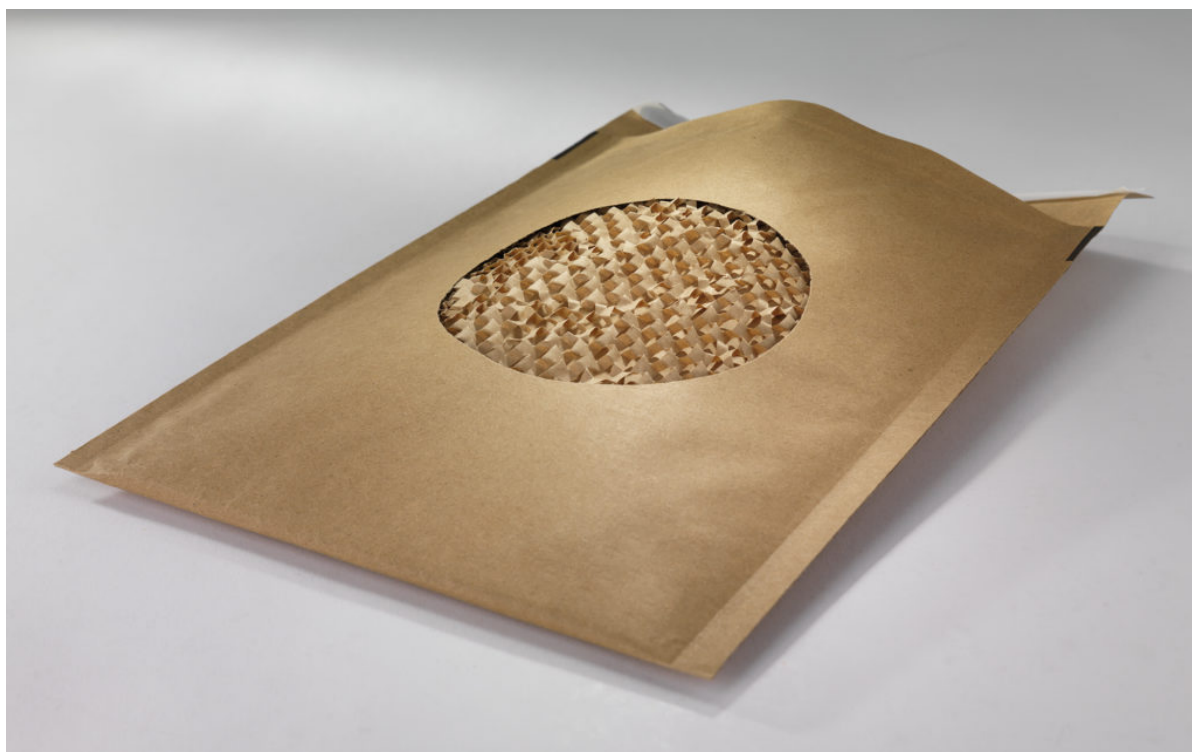
Pochette matelassée alvéolaire