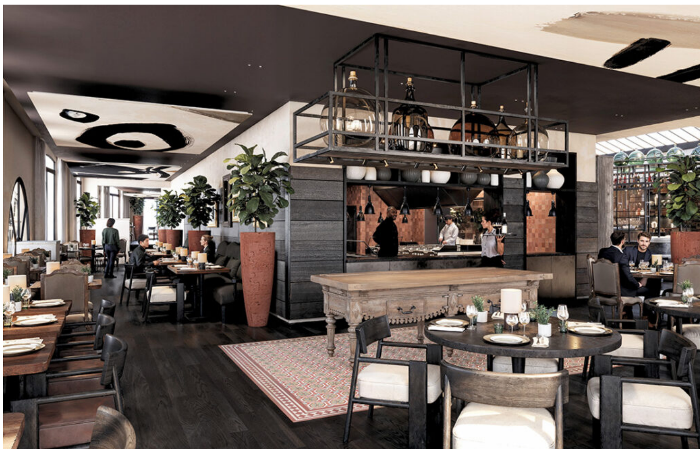
restaurant