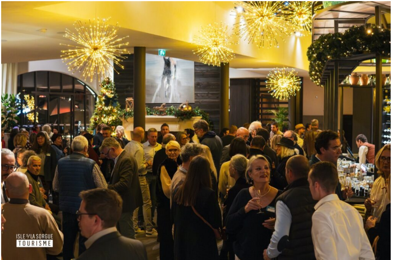
Isle sur la Sorgue Tourisme