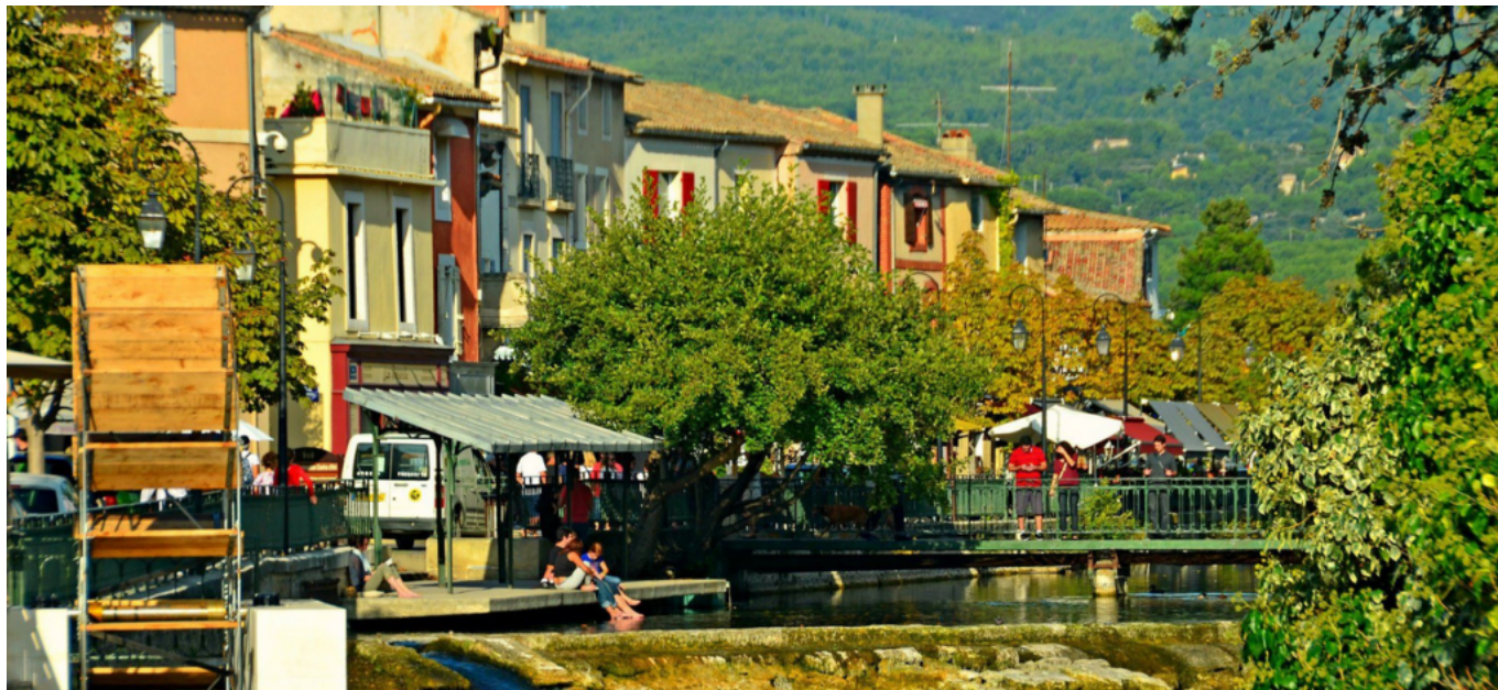
DR La Venise Comtadine