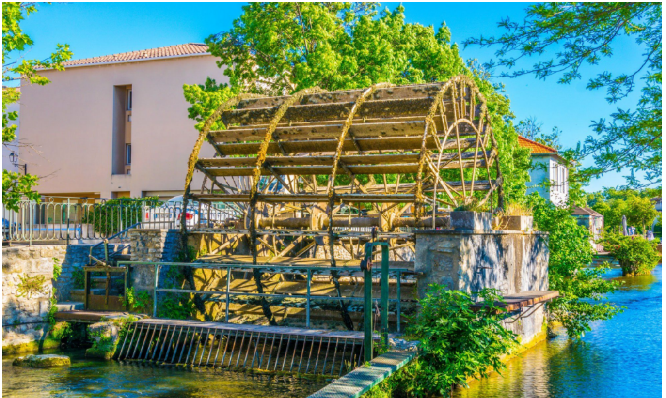
DR Les roues à aubes de l'Isle-sur-la-Sorgue

Si la Venise Comtadine adore qu'on la qualifie de Capitale des antiquités toute l'année et du shopping indépendant, elle veut ouvrir encore plus grand l'éventail de son charme... Pour développer le tourisme vert alors elle cible «les vacanciers traditionnels -qui ne bénéficient pas d'une communication particulière pour éviter le sur tourisme- ; la clientèle nature/outdoor dont l'approche nature et sport peut se faire toute l'année ; la clientèle de proximité qui s'est révélée essentielle pendant la crise -la clientèle étrangère. Et puis il y a le tourisme d'affaires qui pourrait être développé par Belambra (plus de 50 clubs nichés dans les plus beaux endroits de France),» assure Eric Bruxelles.