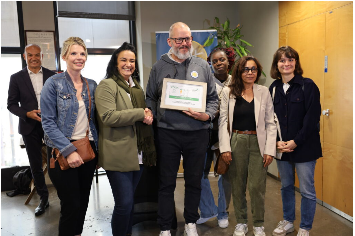
Collège Anne Franck, Morières-lès-Avignon