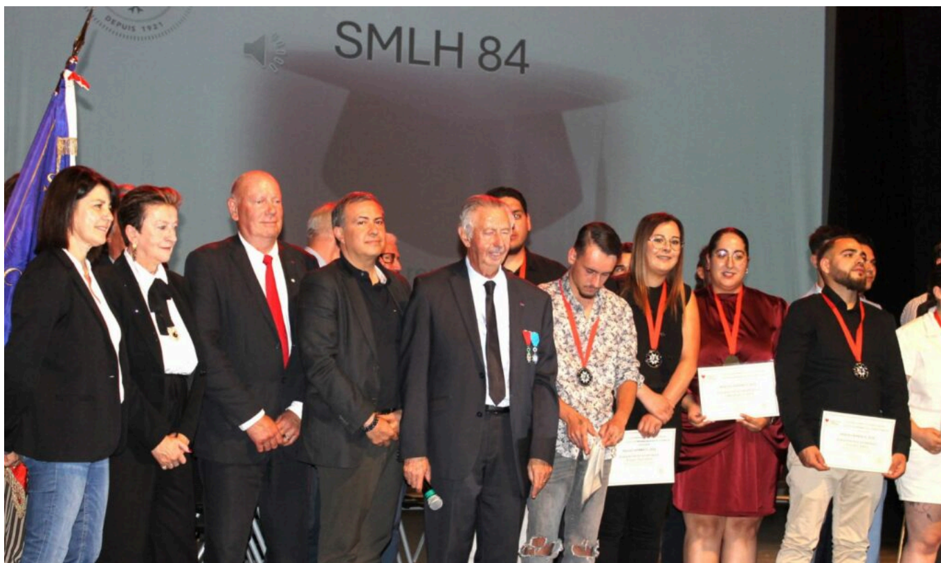
Les candidats primés et les membres de la SLMH84.

Pendant l'année scolaire, leurs professeurs ont détecté les élèves les plus méritants, ceux issus de milieux défavorisés, ceux qui avaient des problèmes de santé (autiste Aperger, handicapé, dyslexique) et proposé leurs noms aux membres de la SMLH 84. À leur tour, ils ont épluché le cursus de chacun, évalué son courage, sa pugnacité, sa détermination pour s'en sortir dans la vie professionnelle. En provenance d'une dizaine d'établissements (Centre Forestier de la Bastide des Jourdans, IFRIA - Métiers de l'agro-alimentaire - Nextech, CFA BTP Florentin-Mouret, Vincent-de-Paul, CCI Avignon Fenaisons, Campus Provence-Ventoux Louis Giraud, Conservatoire, Caserne des Pompiers).