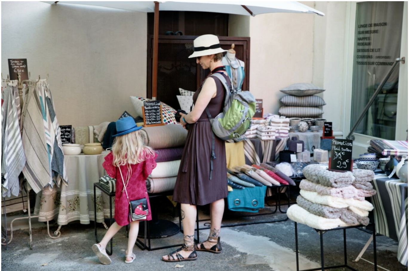
MOUTON C - VPA

Du 29 février au 3 mars 2024, les commerçants du centre-ville de l'Isle-sur-la-Sorgue proposent une grande braderie organisée deux fois par an, à la fin de l'hiver et à l'automne et réunit commerces de bouche, prêt à porter, commerces de décoration, bijoux, jouets et même des restaurateurs. Les commerçants participants sont identifiés au moyen d'une affiche apposée sur leur vitrine. Cet événement commercial biennuel est porté par le service commerce de la Ville de l'Isle-sur-la-Sorgue très attachée au commerce de proximité.